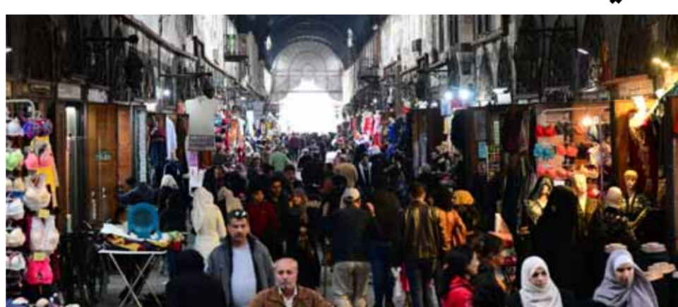
أسواق دمشق ستفتتح زوارها بعد الساعة الثامنة مساءً بعد تطبيق قرار المحافظة