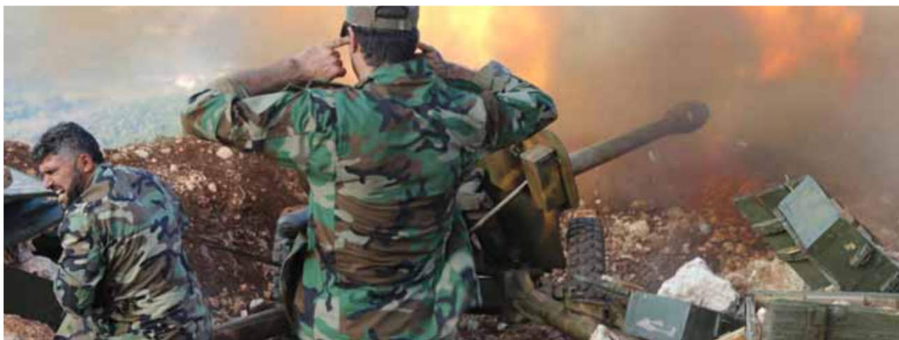
قوات للجيش العربي السوري تستهدف مواقع الإرهابيين في «حفص التصعيد» (عن الانترنت)

وأرض شاسعة من حماة وإدلب وحلب خلال عملياته العسكرية وحلب العام الجاري. ميدانياً، رد الجيش العربي السوري أسس على خروقات الإرهابيين لوقف إطلاق النار، واستهدف غرفة عمليات «الفتح المين» في كل من سفون والغفيرة وكثيفة وإبني جبل الزاوية جنوب إدلب، واستهدفت مدفعيته مراكز إرهابيين «النصرة» في زيزون وسقطون والدماق والزبادية في سهل الغاب الشمالي الغربي غرب حماة، محققاً إصابات مؤكدة في صفوف الإرهابيين وعتادهم العسكري.