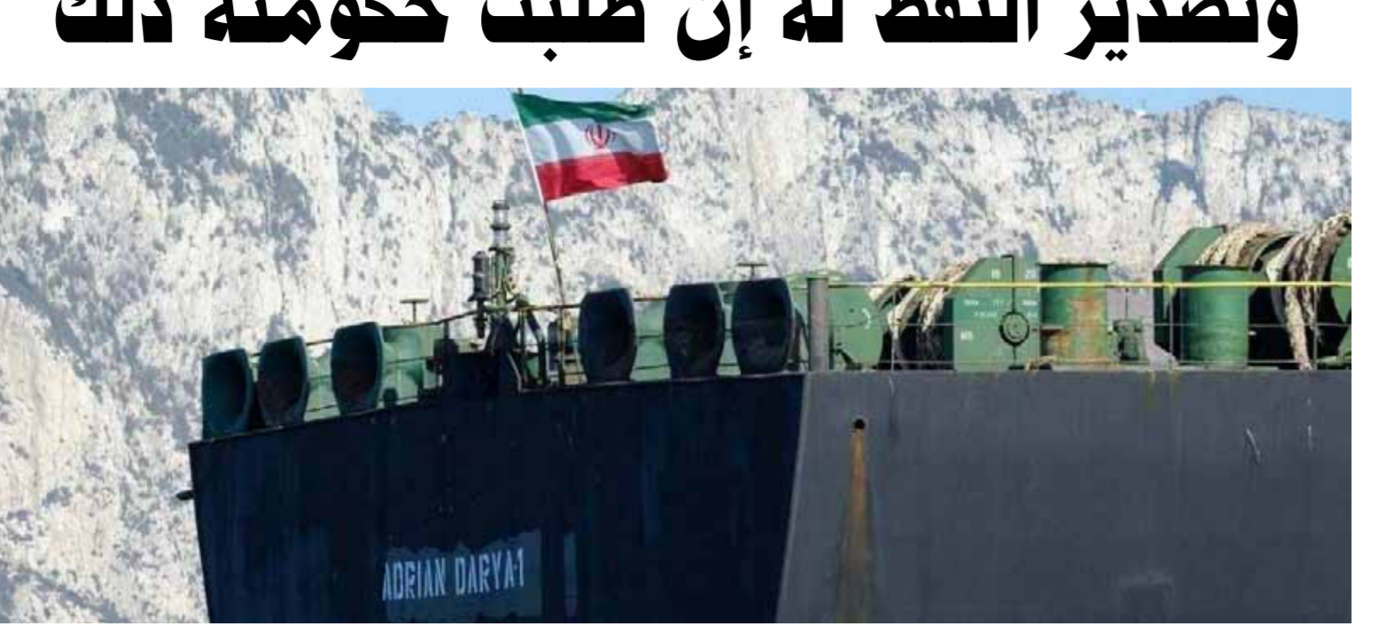
باخرة النفط الإسرائيلية المنتجة إلى لبنان (من اليمين)

بعد تصريحات أمام «حزب الله اللبناني» حين حضر لهم في الحرب البحرية بين إيران والحرس الثوري في لبنان، بينما أكد طهران، إسرائيل، على عدم تغيير موقفها من معادلة الردع. وقال الإعلام الإسرائيلي إن حزب الله وسّع معادلة الردع إلى قلب المتوسط. وأضاف الإعلام الإسرائيلي إن حزب الله وسّع معادلة الردع إلى قلب المتوسط. وأضاف الإعلام الإسرائيلي إن حزب الله وسّع معادلة الردع إلى قلب المتوسط.