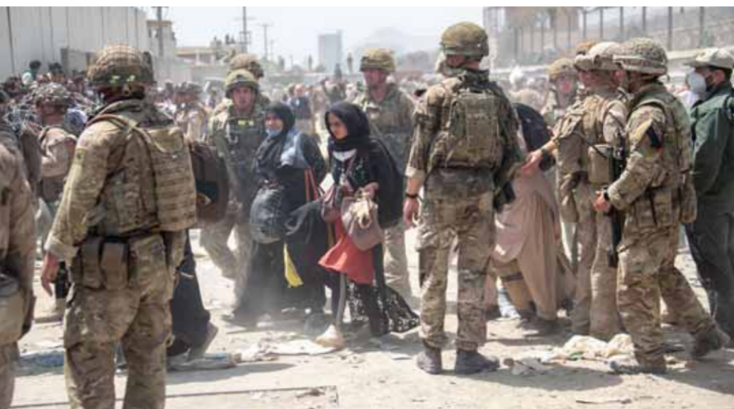
أفراد من القوات المسلحة البريطانية والأميركية يعملون في مطار كابل لإجلاء مدنيين (أ ب)

وتابع قائلاً: «إذا مُدّ جدولهم الزمني حتى يوم أو يومين، فسنبعثنا ذلك يوماً أو يومين آخرين لإجلاء الأشخاص». وأضاف قائلاً: «لقد كنا نأمل في إنهاء العملية بحلول ٢١ آب الجاري، وهو أمر متوقع بحلول ١٠ آب الجاري».