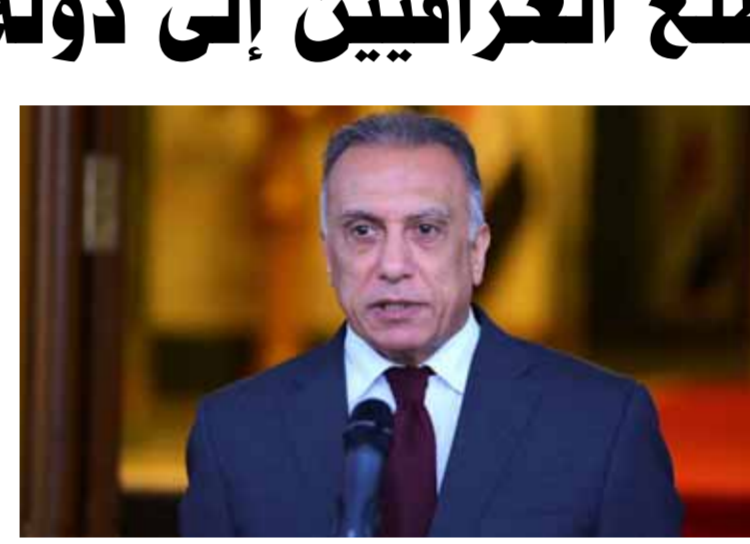
رئيس الوزراء العراقي مصطفى الكاظمي (من اليمين)

أكد الرئيس العراقي مصطفى صالح، أمس الإثنين، أن عملية «الطارمية» هي عملية أمنية شاملة تستهدف القضاء على كافة أشكال الإرهاب، وتأمين حياة المواطنين، وتأكيد سيادة القانون. وقال الكاظمي إن العملية ستبدأ في وقت مبكر، وستكون مدتها ستة أشهر. وأضاف الكاظمي إن العملية ستبدأ في وقت مبكر، وستكون مدتها ستة أشهر. وأضاف الكاظمي إن العملية ستبدأ في وقت مبكر، وستكون مدتها ستة أشهر.