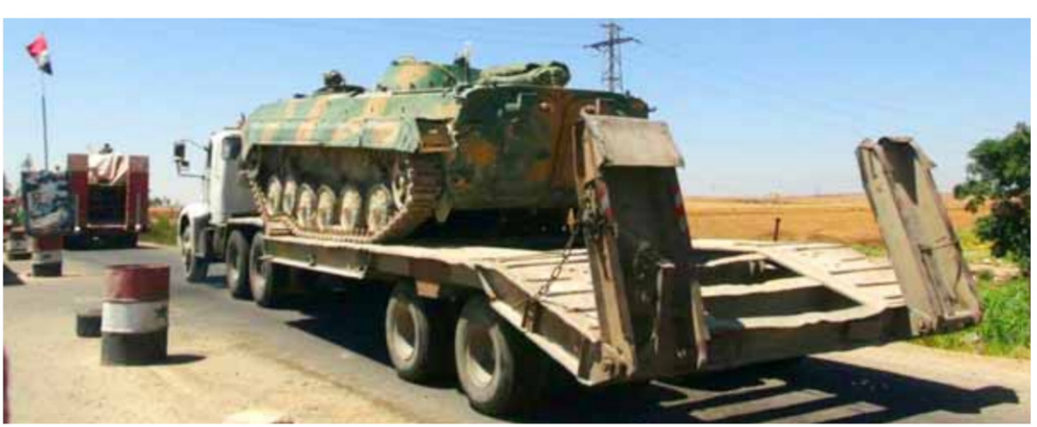
استخدام مزيد من التعزيزات للجيش السوري إلى درعا