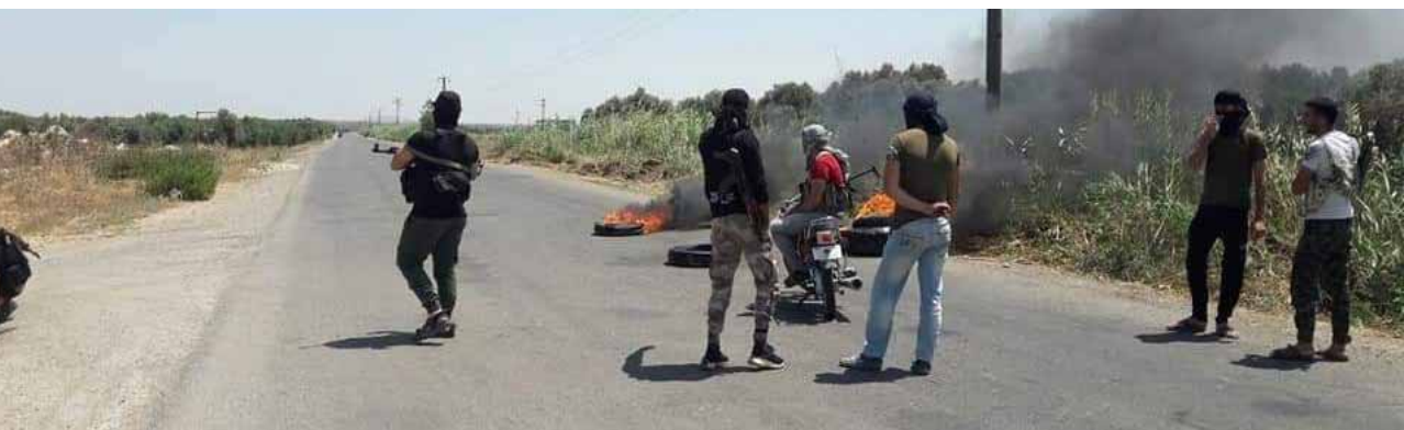
إرهابيو الريف الغربي يلقون الطرقات الرئيسية المؤدية إلى منطقة حوض اليرموك غرب درعا (عن الانترنت)

الجنوبي، وفي بلدة شلخ بريف إدلب الشمالي. ووضوح المصدر، أن الجيش رد بهذه الضربات على اعتداءات الإرهابيين على نقاط له، في خرق واضح لاتفاق وقف إطلاق النار في منطقة «حفض التصعيد»، ولفت إلى أن مجموعات إرهابية مما يسمى غرفة عمليات «الفتح المبين» كانت اعتدت فجر أمس بقذائف صاروخية، على نقاط عسكرية في حوض اليرموك، وبالتراشق مع استهدافه لتبرعاتهم في البرارة وبينين والفيليرة وكضفرة، بريف إدلب الجنوبي.