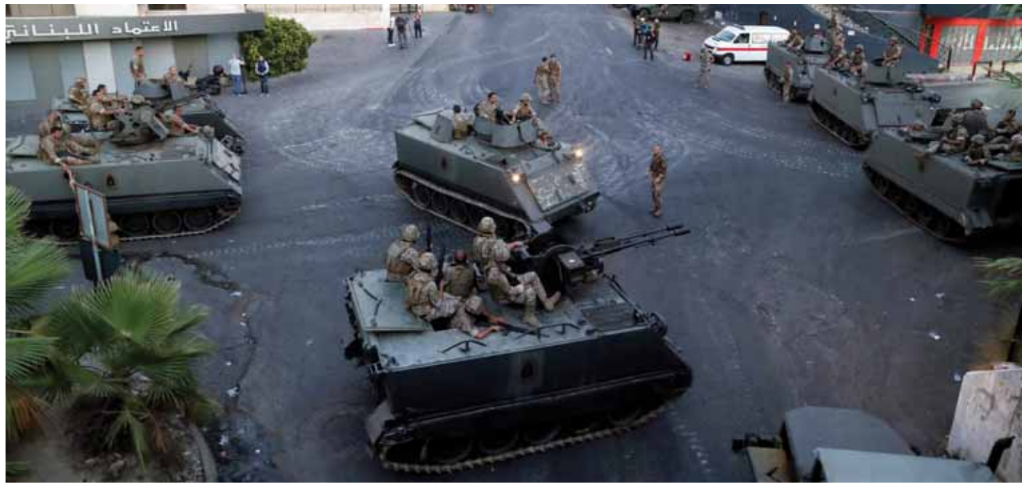
انتشار الجيش اللبناني في منطقة خلدة جنوب العاصمة بيروت

تطالب الجيش والقوى الأمنية بالتدخل الحاسم لفضح الأمن وإعادة الاستقرار للحياة الطبيعية والعمل العادي والسريع وإيقاف مخطفي الأحداث ومطفي النار وتقديمهم إلى المحاكمات. وشهدت منطقة خلدة، أو من أمس، توترات مسلحة إثر إعلان جيشان من عرب خلدة عن إطلاق النار على موكب تشييع الجاني القويدي بمرحله البعث اللبناني، على شلي، ما شعل اشتباكات في عرب خلدة والشبان المشاركين في التشييع، أسفرت عن مقتل ٤ أشخاص وجرح أربعة، والخاصة على حد سواء.