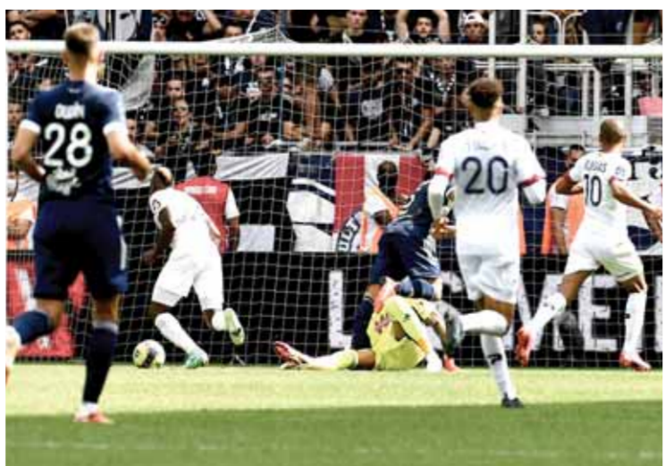
كليمون حقق المفاجأة وغلّب بوردو

الذي وافق على إقامة المسابقة سنوياً برعايته في العام ١٩٨١، وأخراً من ١٩٨٤ إلى بداية ١٩٨٥ ثم إلغاء ذلك العام إلا أن البطولة استمرت مع إقامتها من مباراة واحدة أعوام ١٩٨٤ و١٩٨٦ و١٩٩١ إلا أن نظام الذهاب والإياب بقي صامداً حتى عام ١٩٩٨ عندما قرر الاتحاد الأوروبي إقامتها في أرض محايدة من مباراة واحدة واستقرت على مواجهة بطل الشامبيونز مع بطل كأس الاتحاد (اليوروبالغ فيما بعد) إلغاء مسابقة كأس الكؤوس.