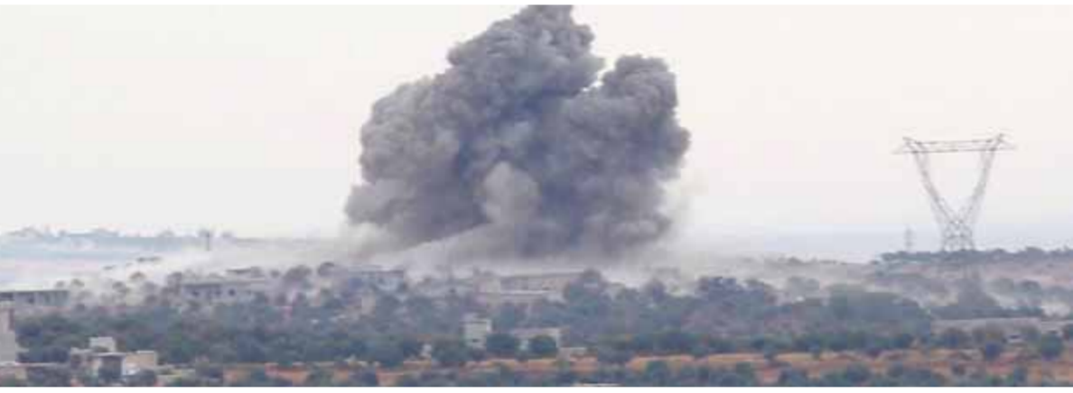
الطيران الحربي يقصف مواقع الإرهابيين في إدلب

التركي، ومن أجل ذلك جاءت الضربات الجوية الروسية الأخيرة، والتي توقعات المصادر أن تتوالى خلال الفترة القادمة بقواصل زمنية أقل من سابقاتها. بالتوازي مع هذه المعطيات، رد الجيش أسس على خروقات إرهابية أقرت لوقف إطلاق النار في ريف إدلب الجنوبي وسهل الغاب الشمالي الغربي غرب حماة، وأدت ضرباته المدفعية إلى قتل وجرح عدد كبير من الإرهابيين في محيط بلدات كصفره والغطيرة وسقوهن بجبل الزاوية جنوب إدلب في المناطق القريبة من خطوط التماس، وتلك الواقعة على خطوط التماس مع سهل الغاب.