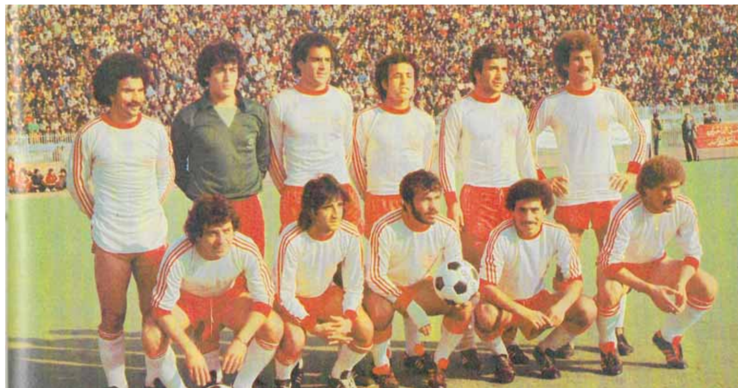
نادي الشرطة بطل ١٩٨٠

استعصت عليه النجمة الثالثة في الدوري منذ ١٩٩٧ حتى ٢٠٢٠. فاعتبر ذلك ولادة جديدة للفريق، وكثيراً ماكانت المناحرات والشجارات بين أهل البيت، سبياً في تأخر وصول البحارة إلى اللقب الثالث الذي بدا مستعصياً حتى فك اللغز، وفي مسابقة الكأس لم يلعب النهائي منذ عام ٢٠٠٦ رغم أنه كان المرشح الأوفر حظاً في أكثر من نسخة أخيرة؛