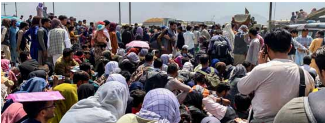
أعداد كبيرة تنتظر الصعود على متن طائرة عسكرية لمغادرة البلاد في مطار عسكري في كابل