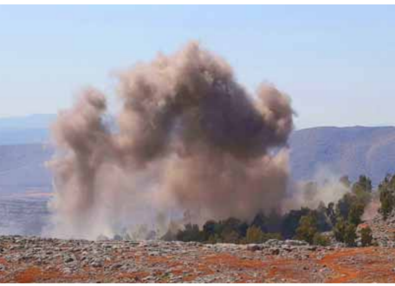
الطيران الحربي يقصف مقرات «هيئة تحرير الشام» الإرهابية في إدلب.

ميدانياً، شن الطيران الحربي السوري والروسي صباح أمس، غارات مكثفة على مواقع ونقاط تركز الإرهابيين في عدة محاور بسهل الغاب الشمالي الغربي من منطقة «خضف التصعيد»، وقتل ١٤ إرهابياً على الأقل وأصيب ١٢ آخرين، في أنفجار استهدف معسكراً تدريبياً لهـ«الوطن» في «الشمام» قرب رام حمدان شمال إدلب، وضاربت الأنبياء حول سبب الانفجار الذي قيل إنه نتج عن ضربة لدطائرة مجهولة»، على حين قالت «رويترز» إن الانفجار نتج عن «خطأ خلال جلسة تدريب».