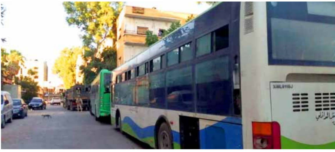
الحافلات تستعد لنقل مسلحي «درعا البلد» إلى شمال البلاد.

الجيش العربي السوري كان قد استقدم صباح أمس تعزيزات عسكرية ثقيلة ضمت رتلًا من دبابت ومدافع ثقيلة وعربات نقل جنود وصلت إلى مدينة درعا لإنهاء الوضع الشاذ في المدينة وإعادة الأمن والأمان لها، كما فتحت وحدات الجيش ممر السرايا أمام المدنيين الراغبين بالخروج من المناطق الواقعة تحت سيطرة الإرهابيين باتجاه درعا الحرة، وقامت الدولة بتجهيز مركز إقامة مؤقت بمختلف المستلزمات والمواد الأساسية لاستقبالهم.