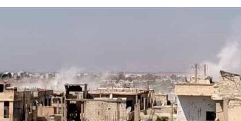
الجيش يرد على مكائن إطلاق القذائف في درعا البلد

الوطن أفشلت ما تسمى «اللجنة المركزية» في منطقة «درعا البلد» المفاوضات مع اللجنة الأمنية في المحافظة، برفضها الالتزام ببند «خريطة الطريق» التي تهدف إلى تسوية الأوضاع في جميع المناطق التي ينتشر فيها إرهابيون، وفرض الدولة الكامل سيادتها في المحافظة، في حين صعد الدواعش من وتيرة اعتداءاتهم على المناطق الآمنة، التي رد عليها الجيش العربي السوري بقوة وخاض معهم اشتباكات عنيفة. وقالت مصادر وثيقة الاطلاع في مدينة درعا له «الوطن» مساء أمس: «فشلت المفاوضات بين اللجنة الأمنية ولجنة «درعا البلد» بسبب رفض الأخيرة دخول الجيش وتسليم السلاح والالتزام ببند التسوية». ومنحت الدولة عشرات المهل للجنة المركزية، في «درعا البلد» لتجنب أي عمل عسكري، ولكن يبدو أن إرادة «أبو إبراهيم العراقي» و«أبو خالد الديري» قادة داعش في «درعا البلد» كانت أقوى من إرادة «اللجنة المركزية»، وجهاتها. وفي وقت سابق أمس، قالت مصادر في مدينة درعا له «الوطن»: إن قذائف الهاون التي يطلقها إرهابيو «درعا البلد» تتساقط على الأحياء الآمنة في المدينة بشكل عشوائي، ودعت بأن قذيفة صاروخية سقطت قرب الكراج الغربي في المدينة، أدت إلى وقوع أضرار مادية لحقت بمنشآت المواطنين، في حين استشهد أحد عناصر الشرطة وأصيب عتصمان بجرحو