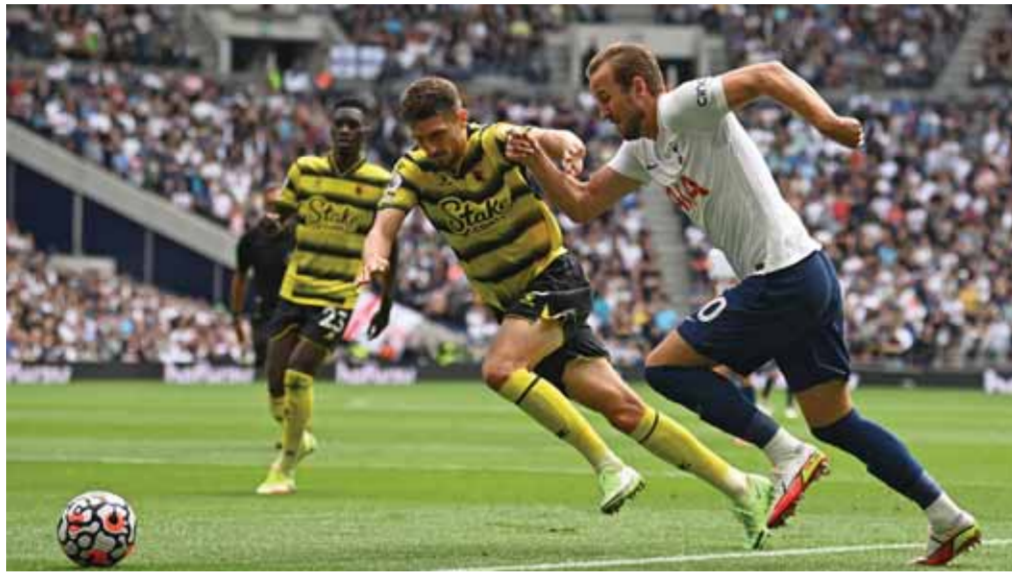
من مباراة توتنهام وانفولدر أمس

جاءت قمة المرحلة الثالثة من الدوري الإنجليزي الممتاز بين ليفربول والسيتي التي جرت مساء السبت على أرضية ملعب أنفيلد في ليفربول مفرحة بمجرياتها عامرة بالندية والإثارة وانتهت بانتصار الحلول التي أرضت الضيف الذي لعب طوال الشوط الثاني بعشرة لاعبين، ومكسب لليفربول من المباراة أنه رفع عدد مبارياته المتتالية من دون خسارة إلى ١٣ مباراة.