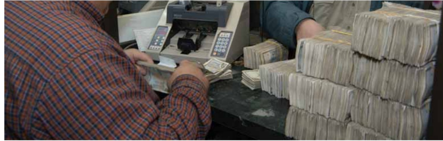
عبد الهادي شباط

كشف مدير عام مصرف التسليف الشعبي نضال العريبي لـ«الوطن» أن حجم السيولة الفائضة والقابلة للتوظيف تجاوزت لدى المصرف ٣٨ مليار ليرة سيتم تشغيلها في منح تسهيلات ائتمانية لتمويل المشروعات وقروض الدخل المحدود، إضافة لمنتجات جديدة يتم بحثها لدى المصرف.