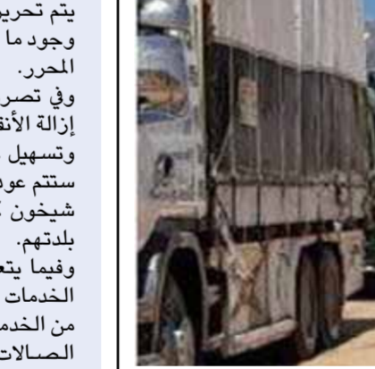
قافلة مساعدات إغاثية تابعة للأمم المتحدة تدخل أسس مناطق «خفض التصعيد» في إدلب عبر معبر «ميزناز»

بشرت قبول الإجراء بأنه يأتي «في إطار نقل مستودعات لبرنامج الغذاء العالمي من حلب إلى إدلب»، وليس تمهيداً لفتح «المعبر الإنساني» مع الحكومة السورية. ورأي مراقبون للوضع في «خفض التصعيد» لـ«الوطن»، أن هذه الخطوة تصب في مصلحة الحكومة السورية ومراميتها الساعية إلى عدم استخدام الحدود بطريقة غير شرعية، وبمساعي موسكو التي تصب في الاتجاه ذاته، الذي يركز على استخدام المساعدات الإغاثية عبر «خطوط التماس» بدل استعمالها «عابرة للحدود»، وما يتناهى مع المواثيق والأعراف الدولية، ما يعني أنه من الممكن عدم تمديد تفويض إدخال