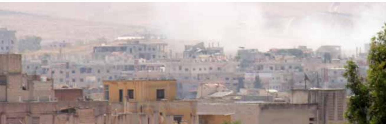
الجيش يرد على اعتداءات الإرهابيين ويستهدف منصات إطلاق القذائف في درعا البلد

أن يدخل الجيش العربي السوري إلى المنطقة، ويريدون بقاء السلاح معهم، ويظهر أن لديهم أسلحة ثقيلة بينها صواريخ ثقيلة يستهدفون بها المدنيين وحواجز الجيش». وسلمت اللجنة الأمنية في المحافظة في ١٤ الشهر الجاري «خريطة طريق» للجنة المركزية، وتهدف إلى تسوية الأوضاع في «درعا البلد» وكافة المناطق التي تنتشر فيها ميليشيات مسلحة في المحافظة، وبالتالي فرض الدولة كامل سيادتها في المحافظة، إلا أن «اللجنة المركزية» والإرهابيين يواصلون رفض تنفيذها.