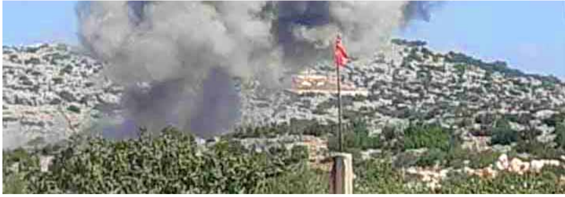
الطائرات الحربية الروسية تستهدف مقرات الإرهابيين في محيط النقطة التركية في جبل الزاوية (عن الانترنت)

وكان ماكفورك وفريشني اجتماعاً بداية تموز الماضي بناء على مخرجات قمة الرئيس الروسي فلاديمير بوتين والأميركي جو بايدن في ١٦ حزيران بجنيف، والتي نتج عنها القرار الأممي الخاص بتبديد إيصال المساعدات الإنسانية في سورية «عبر الحدود» و«الخطوط»، وسيشهد الاجتماع تقييماً للاتفاق الروسي الأميركي الذي يتوقع أن يتوصل إلى ترتيبات جديدة و«صفقات»، منها تمرير المساعدات «عبر الخطوط» بعد فتح «الممرات الإنسانية» التي هي مطلب روسي سبق وأن سعت إلى فتحها أكثر من مرة وأجيش سعاما