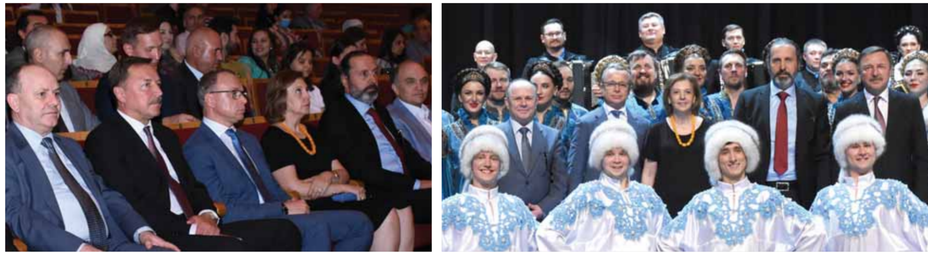
صورة تذكارية جمعت السفير الروسي والوزراء السوريين مع الكورال الوطني السيبيري في دار الأسد