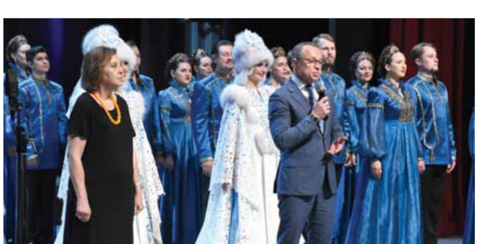
يوري بيتوخوف نائب محافظ نوفوسيبيرسك الروسية ود. لباتة مشوح وزيرة الثقافة أثناء كلمتهما

«الصليب المقدس»، بدمشق. قدمت خلاله عدداً من الترانيل والأغاني الشعبية الروسية بحضور عدد من فرق الكورال السورية التابعة لأكثر من ست كنائس سورية، وبحضور عدد كبير من المهتمين ورجال الدين.