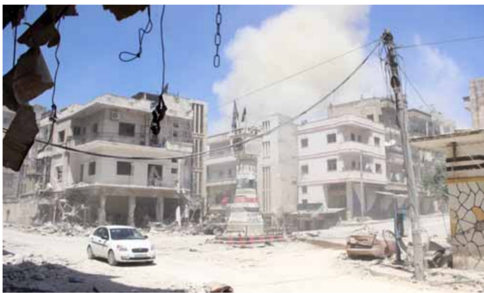
استمرار الاشتباكات بين «النصرة» و«جند الله» الإرهابيين في جسر الشغور وجبل التركمان

حلب- خالد زنگلو في مقابل الهدوء الذي يسود جبهات تل رفعت شمال حلب، صعد جيش الاحتلال التركي من استهدافه لتجمعات «قوات سورية الديمقراطية - قسد» الانفصالية الموالية لواشنطن بريف مدينة تل تمر شمال غرب الحسكة، بالتوازي مع استخدام تعزيزات من الطرفين إلى المنطقة، ما يوشح إلى إمكانية شن عمل عسكري تركي باتجاه تل تمر بعد تركيز الأنظار خلال الأسبوع المنصرم على تل رفعت. وكشفت مصادر معارضة مقرية من ميليشيات ما يسمى «الجيش الوطني»، الذي شكله النظام التركي في المناطق التي يسميها «غصن الزيتون» بريف شمال حلب و«درع الفرات» بريف المحافظة الشمالي الشرقي و«بنبع السلام» شرق نهر الفرات، لـ«الوطن» أن رتلًا من الميليشيات وبأوامر تركية من الغفرض أن يتوجه اليوم الأربعاء من عفرين إلى مناطق شرق الفرات على أن تكون وجهته جبهات تل تمر بالحسكة. وأوضحت المصادر أنه من المتوقع إرسال المزيد من إرهابيي «الجيش الوطني» في الأيام القادمة من «غصن الزيتون» و«درع الفرات» إلى «بنبع السلام»، وخصوصاً إلى مدينة تل أبيض التي استولى جيش الاحتلال التركي عليها مع مدينة رأس العين وصولاً إلى الشريط الحدودي بينها وبين سورية. وذلك بعد أن استقدم جيش الاحتلال التركي وقسده، تعزيزات كبيرة إلى تل أبيض، مبيّنة أن المسؤولين الأتراك في الجيش والاستخبارات بحثوا في اجتماع «تربيتات» العملية العسكرية التركية المزجعة مع متزعمي «الجيش الوطني» لدى استعدادهم إلى تركيا، ويقضي التكتيك العسكري أن يزعج ٣٥ ألفاً من إرهابيي الميليشيات من الذين شاركوا في عمليات عسكرية سابقة في الخطوط الأمامية للجبهات المفترضة في تل