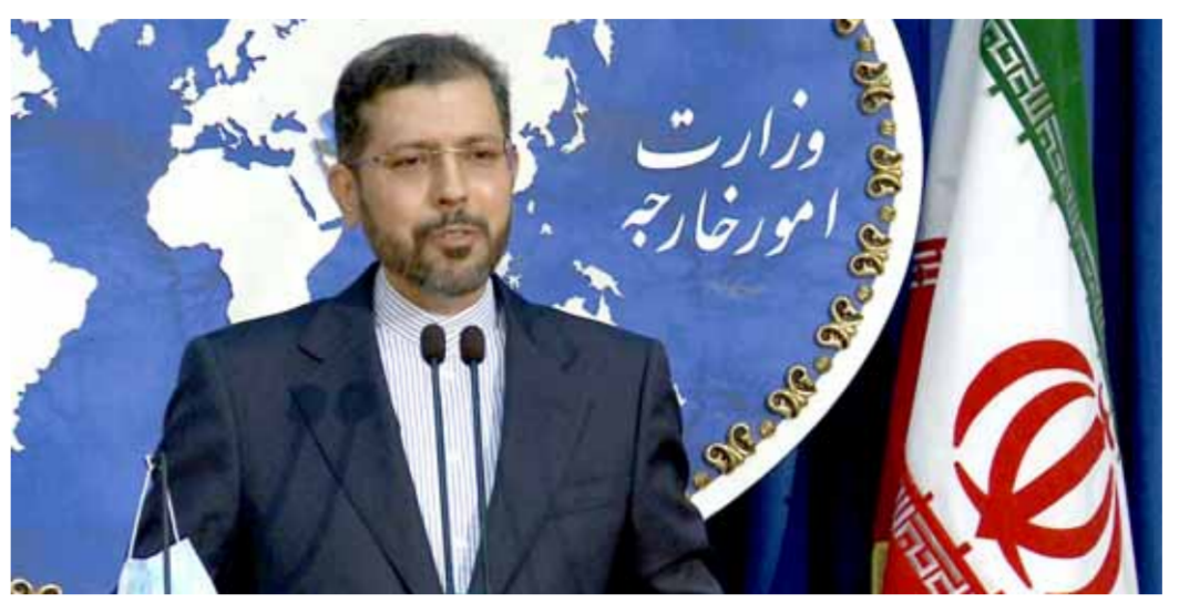
التحدث باسم الخارجية الإيرانية سعيد خاتبي زادة (من اليمين)