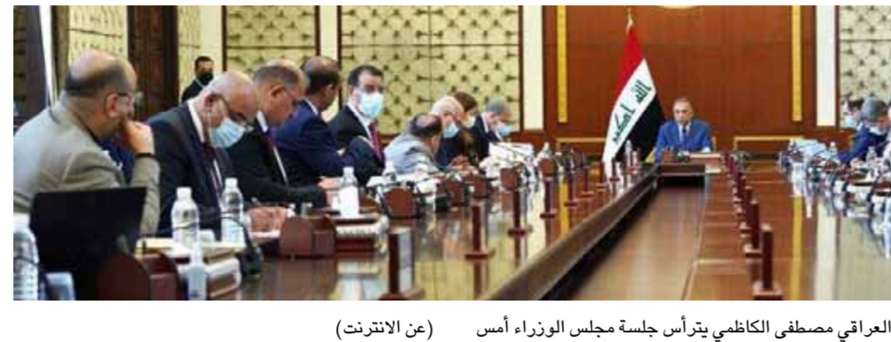
رئيس الوزراء العراقي مصطفى الكاظمي يترأس جلسة مجلس الوزراء أمس (من الأشرطة)