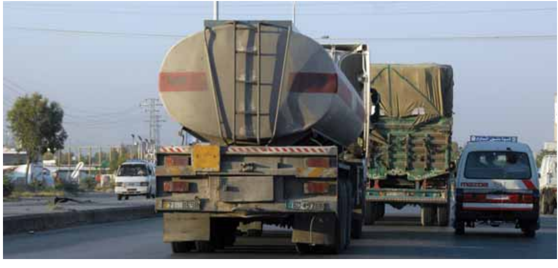
هذا التوزيع كما غرف الصناعة والتجارة.. الصناعي قادر على شراء مخصصات السنة وتخزينها، ولكن المزارع بحاجة لتسويق وتوزيع شهري أو موسمي، وتفتقر: تصنيص مخصصات الفلاح أولوية مطلقة وأن يتم حجز مخصصات مسيعة لمصلحة المزارع توضع شهرياً على الفلاح.

ترك القرار الخاص برفع سعر المازوت من ٦٥٠ ليرة إلى ١٧٠٠ ليرة دهشة عند معظم الصناعيين على حين البعض اعتبره خطوة إيجابية رغم الارتفاع لكن هذا الارتفاع جاء مشروطاً بتأمين المادة ولاسيكون الوضع كارثياً لجهة ارتفاع الأسعار.