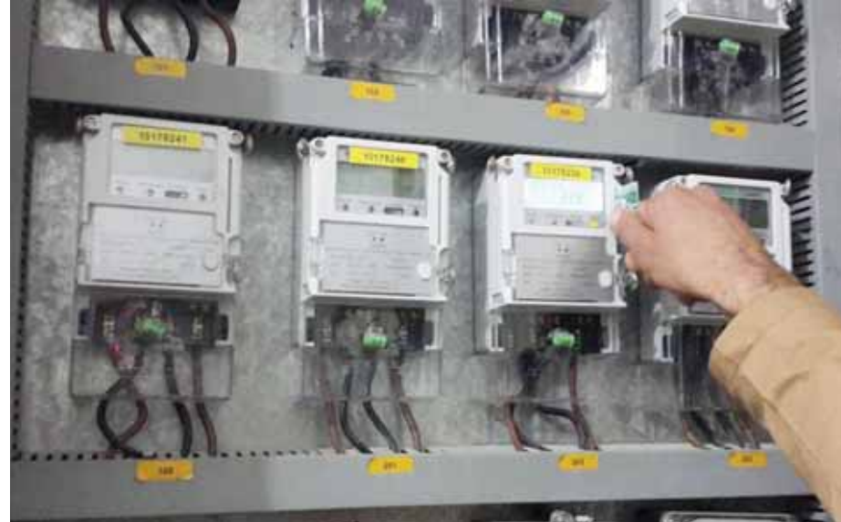
شريحة من المواطنين يبينت المذكرة أن التعديل سيكون (طفيفاً) بحيث يجري تخفيض الخسائر المالية بنسبة ١,٣ بالمئة من الدعم وتعديل لتعرفة للمشاركين بإثارة

كشفت مذكرة رسمية اطلعت «الوطن» عليها عن رفع ترميمي للدمع عن مبيع الطاقة الكهربائية مختلف القطاعات الاقتصادية، إضافة لشرائح العلبا من الاستهلاك المنزلي التي يزيد استهلاكها على ١٥٠٠ كيلواط ساعي في الدورة الواحدة بما يسهم في تحقيق تخفيض بالخسائر المالية لمؤسسات الكهرباء الناجمة عن الدعم المباشر وتوفير السيولة المالية لاستمرار عمل المنظومة الكهربائية، وكذلك تخفيض التكاليف للاعتماد على مصادر الطاقات المتجددة لتغطية جزء من استهلاكهم أسوة بالعميد من الدول، إضافة لرفع كفاءة الاستخدام، وأن تعديل (زيادة) التعرفة للطاقة الكهربائية هدفه حالياً تحقيق تخفيض الخسائر المالية بنسبة ٥٠ بالمئة من الدعم، عدا المشتركين الزراعيين والجمعيات الخيرية التي سيتم تعديل التعرفة لهما بحيث يكون هناك تخفيض بالخسائر المالية بنسبة ٢٠ بالمئة من الدعم قبل تعديل التعرفة.