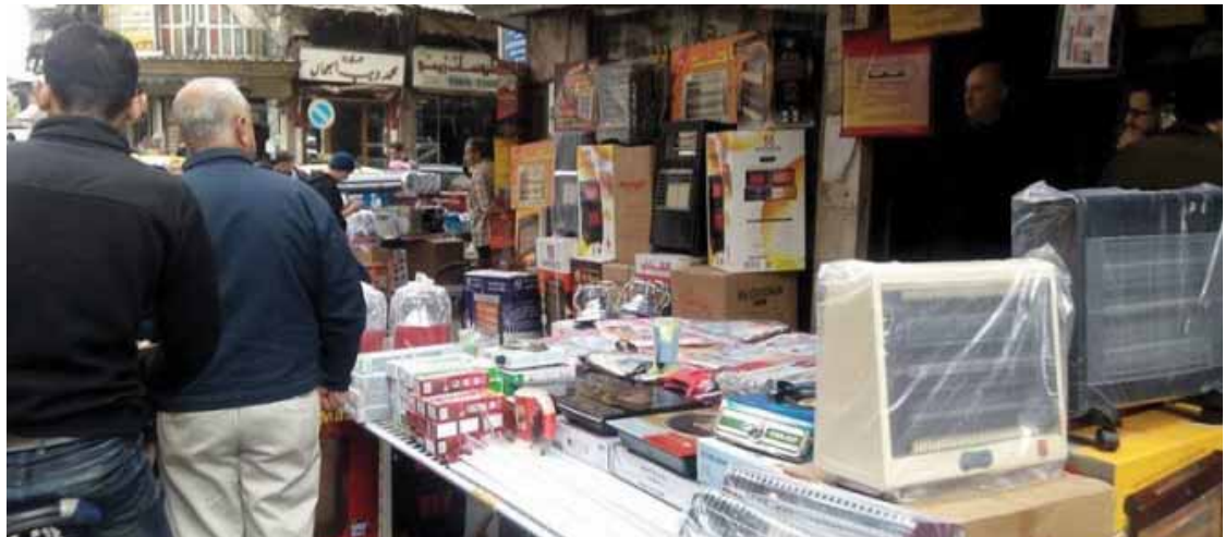
عن الكفالات ويسمعون الرد فوراً من البائع لا توجد كفالة، وكفالتنا للتشغيل فقط وغير مسؤول عن القطعة بعد خروجها من المحل. «الوطن» سألت في الأسواق عن الكفالات للأجهزة الكهربائية المنزلية والحاسب وتوابعها والهواتف الثابتة، وأجهزة الراوتر والساعات اليدوية والإلكترونية وقطع تبديل السيارات والأجهزة الطبية والأدوات الصحية وغيرها من البنية المشابهة، ليأتي الرد الفوري والمباشر مع الامتناع من السؤال عن الكفالة كالتالي

في سوق الكهرباء بدمشق لم يعد المشتري يعرف مصدر هذا الإلزام الذي بدأه منذ بضعة أشهر، ويمن أن سعر البيض في الدول المجاورة يرتفع أكثر من السعر في سورية والصدوق الذي يتسع ١٢ كرتونة في دول الجوار مثل لبنان بحدود ٣٥ دولاراً لذا ليس هناك أي إمكانية لاستيراد البيض المجددة من سوريا. وبخصوص توريث البيض بين حداد أن هناك تهريباً حالياً للبيض من المناطق الشرقية ونسبته لا تتجاوز ١٠ بالمئة من الإنتاج وتوقع حداد أن ينخفض سعر كرتونة البيض انخفاضاً طفيفاً خلال شهر تقريباً بحدود ٥٠٠ ليرة لكرتونة الواحدة. وعن تأثير قرار وزارة التجارة الداخلية وحماية المستهلك بتحديد سعر المازوت الصناعي بـ ١٧٠٠ ليرة على أسعار البيض وذلك عقب تأكيد وزارة التجارة الداخلية بأن تحديد السعر جاء بعد تقديم كل الأنشطة الصناعية والتجارية والزراعية ومربي السحرة الفروج والأبواض شكوى من شراء المازوت من السوق السوداء بسعر وصل إلى ٤٠٠٠ ليرة سورية للتر للتر الواحد، وأكد حداد أن هذا القرار إيجابي لكن تأثيره على سعر البيض سيكون قديلاً ومن المتوقع انخفاض سعر المازوت من ٣٧٠٠ ليرة إلى ١٢٠٠ ليرة، وتنبأ حداد أن سعر البيض سيخفض سعر كرتونة البيض بحدود ٢٠٠ ليرة فقط.