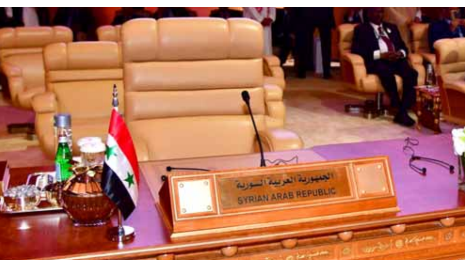
مقعد الجمهورية العربية السورية الفارغ في الجامعة العربية

بلاده تجاه سورية كان ثابتاً يوماً، وأن بلاده تؤمن بأن الأزمة السورية استغرقت وقتاً طويلاً وسيبت الكثير من المعاناة، فيما لم تظهر أي إستراتيجيات فعالة لحلها على حد تعبيره، مشيراً إلى أن الحكومة السورية طرف ويجب الحديث معها حول كيفية تحقيق حل سياسي. وزير الخارجية الأردني اعتبر بأن هناك حاجة إلى وجود حوار بين الولايات المتحدة وروسيا بشأن سورية، والاتفاق على حل للضي