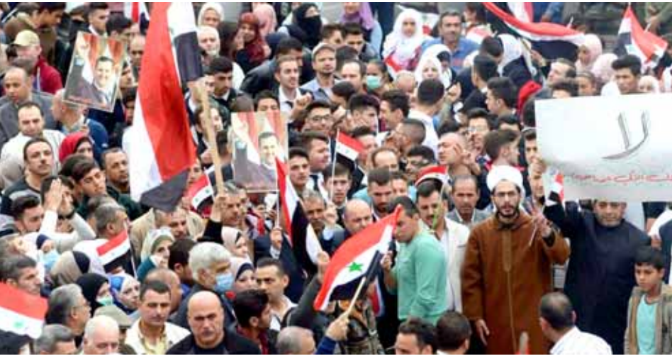
أهالي بلدة تل رفعت يجردون خلال وقفة احتجاجية رفضهم للاحتلال التركي

بأن القيادة الروسية لم تتخل عن مطلب إعادة الحركة للحزب من الطريق الذي يصل حلب باللاذقية. وبالنسبة إلى المساعي الأميركية لتثبيت خطوط تماس مناطق شمال شرق البلاد، أشار المتتبعون، إلى بروز معطى جديد أول من أسس على غاية من الأهمية وله ارتدادات كثيرة في ميادين المعركة في حال حدوثها، وتمثل في سعي القوات الأميركية لإنشاء قاعدة عسكرية في تل تمر لربح أي تحرك تركي باتجاهها، بالإضافة إلى استخدام تعزيزات عسكرية جديدة في باقي المناطق لتأكيد عدم تخلي واشنطن عن دعمها للقوات السورية الديمقراطية-القسدية، بالإضافة إلى محاولة لها، على الأقل في المرحلة الحالية.