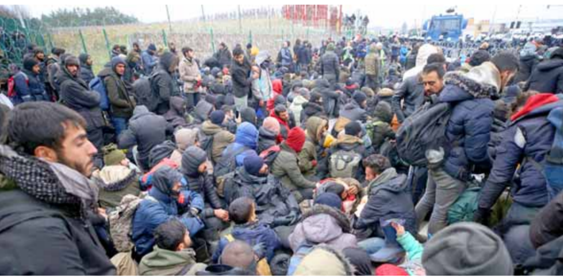
لاجئين أمام معبر كورنيكا البولندي على الحدود الليتوانية-البولندية (من اليمين)

محلقتان غربيين في ليبيا والعراق، إضافة إلى الدعم المقدم من الغرب في سورية لتفكيكات مصففة غربية بها المعتدلة.