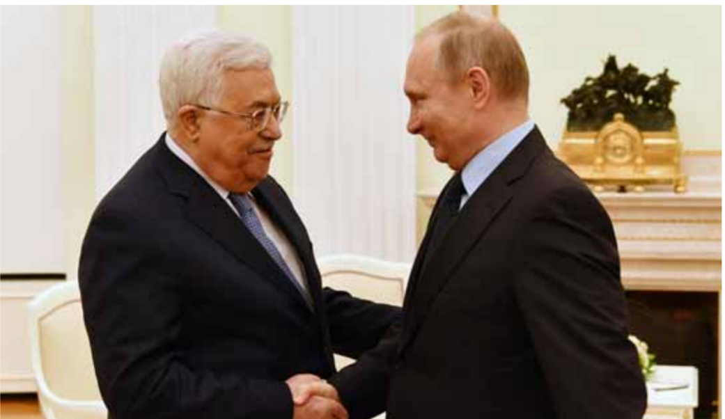
من لقاء سبيل بين الرئيسين الروسي فلاديمير بوتين واللفلسطيني محمود عباس (من اليمين)