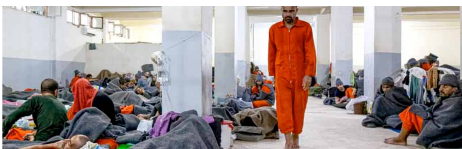
مليشيات «قسد» تعتزم إطلاق سراح مئات السجناء المتهمين بالتعاون مع مرتزقة النظام التركي

وهو ما أكده الشلال في حديثه لـ«الوطن» والذي وصف الذين خرجوا بهذه التظاهرات بأنهم عبارة عن مجرمين ومطلوبين من الدولة السورية وهؤلاء لا تشملهم أي تسوية لأن أيديهم ملوثة بدماء السوريين، وليس من مصلحتهم وصول القوات الصديقة ودخول الجيش العربي السوري لاحقاً إلى هذه المناطق. بالتوازي أعلنت المؤسسة العامة لمياه الشرب في الحسكة أن تأخر ضخ المياه إلى مركز المدينة لليوم الثاني على التوالي. وفي السياق ذكرت مصادر أهلية أن مرتزقة الاحتلال التركي بدأوا بسرقة الكهرباء من الخط المغذي لآبار علوك بهدف استغلالها لصالحهم الخاصة وبشكل عشوائي في الأراضي والممتلكات التي استولوا عليها من مالكيها الأصليين بقوة السلاح ما أضر بتشغيل المحطة وفاقم معاناة الأهالي. وقال مصدر في مؤسسة المياه حسب