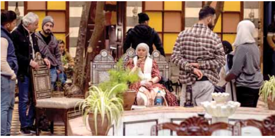
من مسلسل «حارة القبة»

«باب الحارة» يستمر في فتح أبوابه ومازالت التحضيرات مستمرة لبدء تصوير الجزء الثاني عشر من مسلسل «باب الحارة» لكتابه «مروان قاووق» ولم يتم التأكد من اسم مخرج العمل حتى الآن.