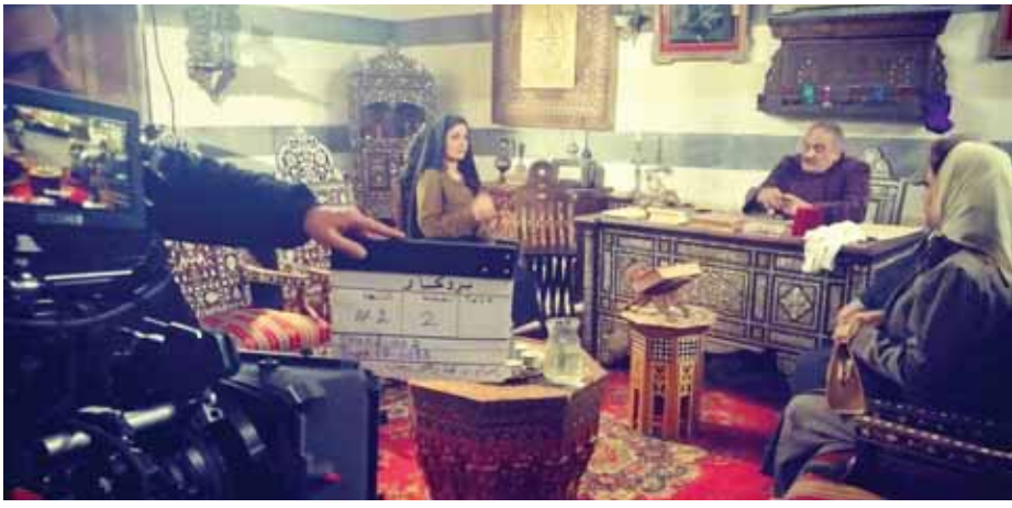
من مسلسل «بروكار»