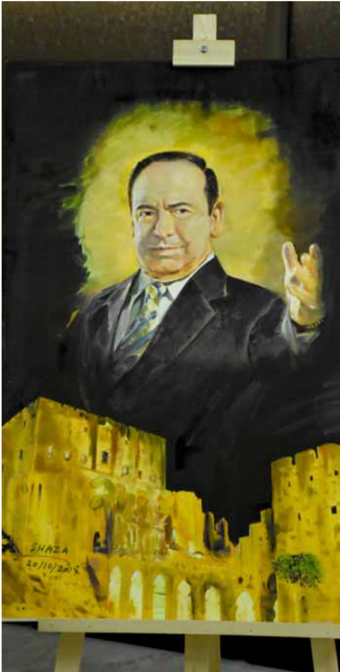
لوحة بريشة الفنانة شدا نصار