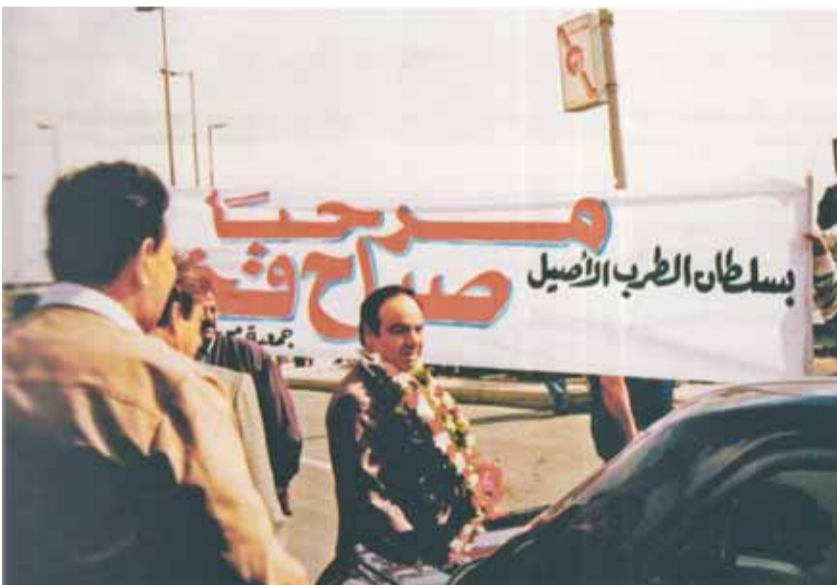
ضيفاً على جمعية محبي صباح فخري في مصر