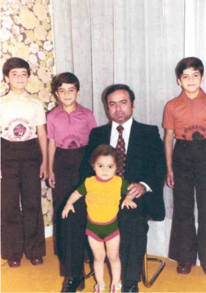
مع أولاده في باريس