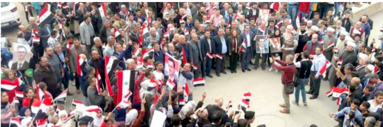
وقفة احتجاجية ضد الاحتلال التركي ومرتبته من الإرهابيين في تل رفعت بريف حلب (سانا)

«الجيش الوطني» لـ«الوطن»، أن القاعدة العسكرية التركية على تلة الشيخ عقيل شمال الباب، ضمت ضباطاً من الشرطة العسكرية الروسية إلى ضباط من جيش الاحتلال التركي في اجتماع لبحث قضايا الخلاف والتوافق بين الجانبين. في السياق ذاته، نقل موقع «باسنيوز» الكردي عن مصدر لم يسمه، أن محادثات «جدي» روسية مع الروس، وهي تعمل بالفعل، ونحن نستخدمها لضمان تقادي أي أخطاء وعواقب غير مقصودة، وإننا نعتزم مواصلة استخدام هذه القناة لتقادي الصدام».