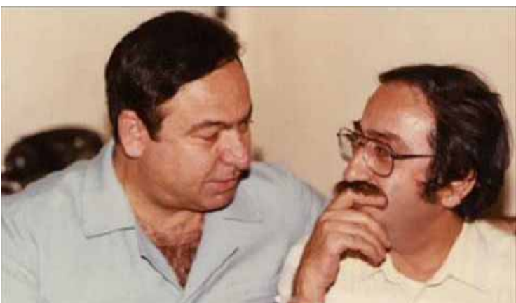
مع الفنان الكبير دريد لحام

الساعة ٩:٣٠: مغادرة الجثمان من مستشفى الشامي في دمشق. الساعة ٩:٤٠: التوجه عبر شارع جواهر لال نهرو مروراً بساحة الأمويين، وصولاً إلى جسر الثورة باتجاه مدينة حلب، مسقط رأس الفنان الراحل. الساعة ١٤:٠٠: الوصول إلى مدخل مدينة حلب. الساعة ١٤:١٠: التوجه إلى جامع عبد الله بن عباس. الساعة ١٤:١٥: صلاة العصر وصلاة الجنازة، ويقدم الصلاة مفتي الجمهورية أحمد بدر الدين حسون. الساعة ١٤:٤٥: الوصول إلى المقبرة الحديثة حيث يوارى جثمان الراحل الكبير. العزاء في حلب: من السادسة وحتى التاسعة في صالة الأمويين أيام الخميس والجمعة والسبت الموافق في ٤ و٥ و٦ تشرين الثاني. العزاء في دمشق: من الخامسة وحتى التاسعة في صالة دار السعادة يومي الاثنين والثلاثاء ٨ و٩ تشرين الثاني.