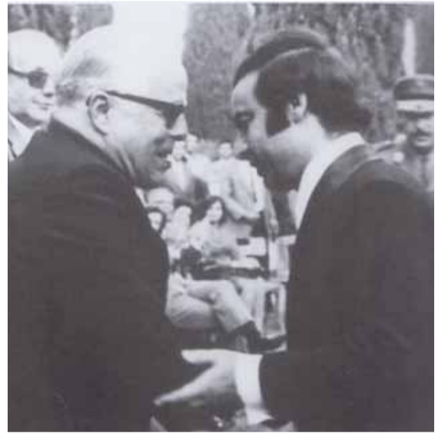
صباح فخري مع الرئيس التونسي حبيب بورقيبة