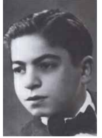
صباح فخري عام ١٩٤٦