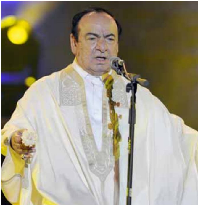
في مهرجان قرطاج الدولي بتونس