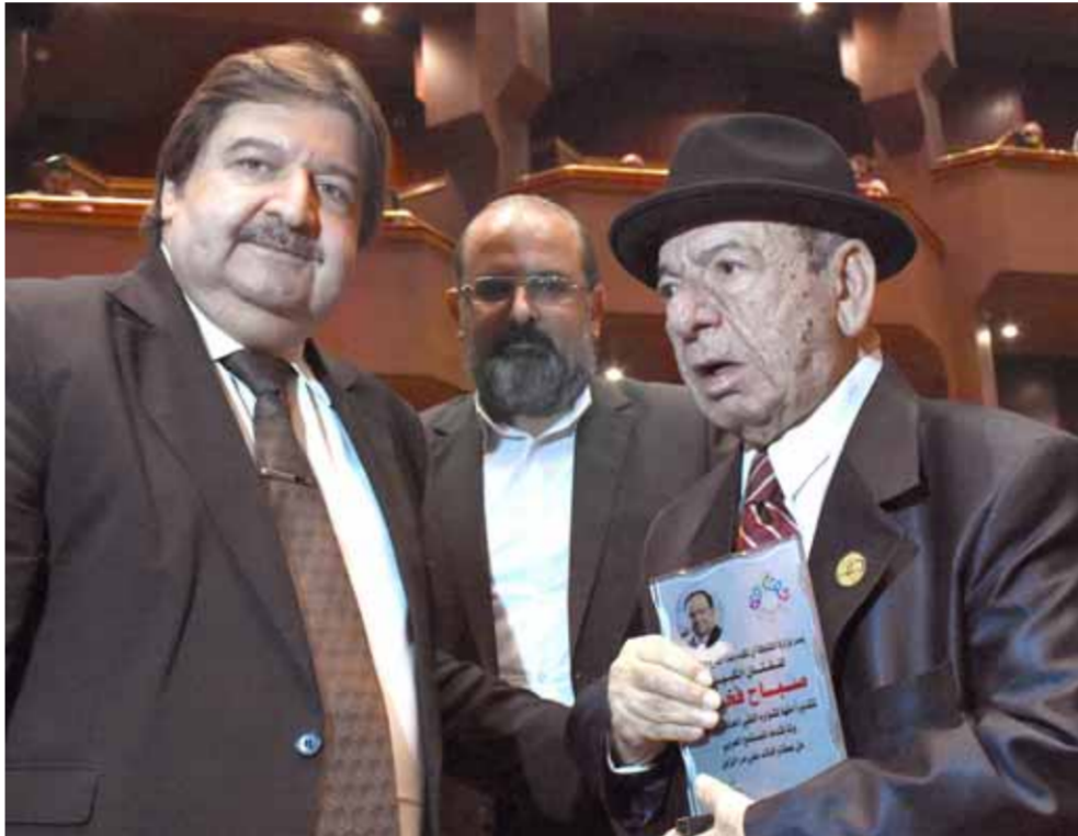
الراحل صباح فخري مكرماً من وزارته الثقافة والتربية