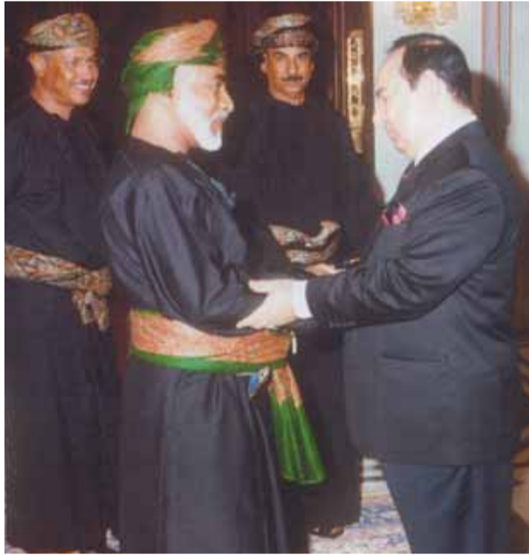
مع سلطان عمان قابوس بن سعيد