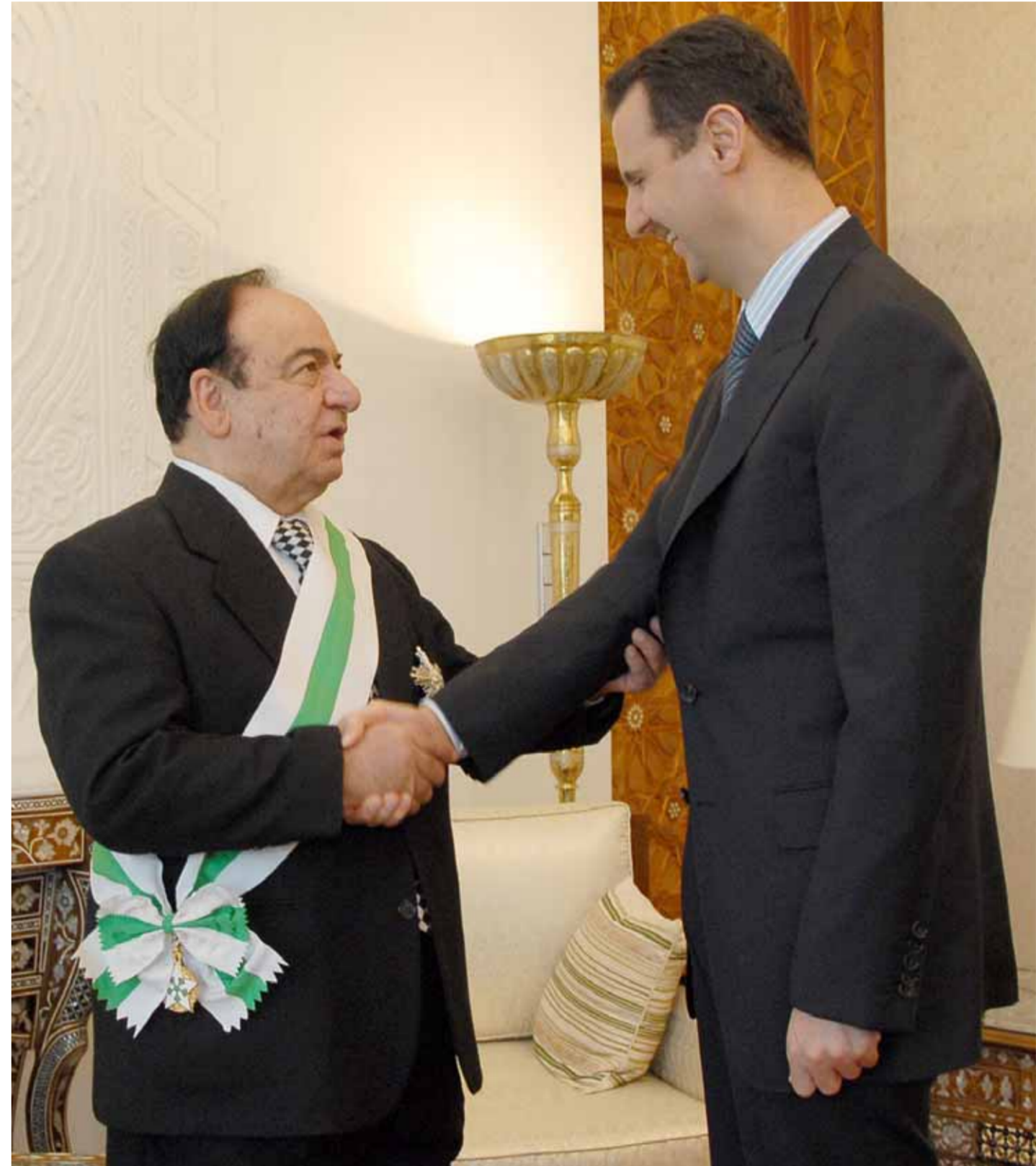
الرئيس بشار الأسد يقبل صباح فخري وسام الاستحقاق السوري من الدرجة الممتازة ٢٠١٧