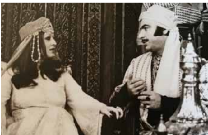
صباح فخري ووردة الجزائرية في مسلسل «الوادي الكبير»