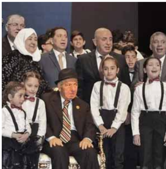
مكرماً من أطفال سورية