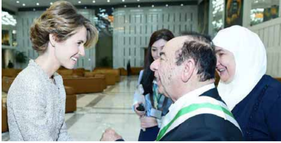
صباح فخري وزوجته مع السيدة أسماء الأسد