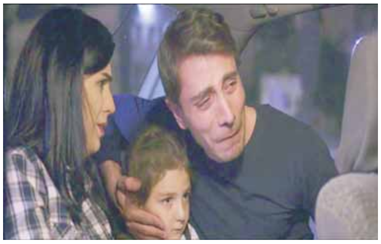
من مسلسل «روزنا»

الدراما والكوميديا والقضايا الإنسانية، بالإضافة إلى الخطوط التي تتحدث عن الحب، بشكل عام العمل خفيف وأمنى أن ينال إعجاب المشاهد.