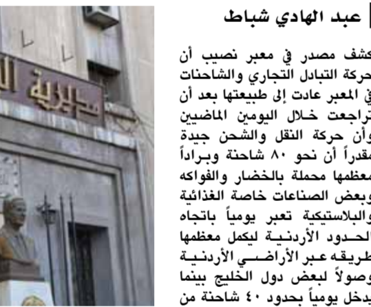
عبد الهادي شباط

جميعها بالنسبة لأي عمل يخص هذه الأطراف فالتاجر اليوم بحاجة للتنسيق مع الزراعي والعكس صحيح كما أن التاجر كذلك بحاجة للتنسيق مع الصناعي كذلك والعكس صحيح، موضحاً أن المزارع لا يستطيع بيع منتجاته الزراعية بمفرده وهو بحاجة للتاجر من أجل تصريف منتجاته وهذا هو محور التعاون القادم بين غرفتي الزراعة والتجارة. وبين الخطاب أنه تم الاتفاق خلال الاجتماع على التعاون مستقبلاً بين الطرفين بشكل أساسي، مبيّناً أن أعضاء غرفة زراعة دمشق طرحوا موضوع الشراكة مع الغرفة بالنسبة للخط التوضيبي الموجود في منطقة عدرا والذي تشترك فيه غرفة الزراعة مع اتحاد الفلاحين حالياً وذلك في حال انسحاب اتحاد الفلاحين من هذه الشراكة وهذا الأمر تم طرحه ولم يتم الاتفاق عليه بعد. وأوضح أن أعضاء غرفة زراعة دمشق أكدوا لنا خلال الاجتماع أن هناك صعوبات تواجه الزراعة بخصوص التصدير لكثير من يرسلوا أي مذكرة لغرفة التجارة تتضمن هذه الصعوبات، وبخصوص موضوع طرح استخدام النقل الجوي في شحن بعض المواد الزراعية لخصائصها التي لا تحتمل النقل البري، كما يتم عضو مجلس إدارة غرفة زراعة دمشق بإسكال الكاتب من غرفة الزراعة إرسال المعوقات التي تواجه الزراعة بالنسبة للتصدير أو رفعها بمذكرة لإيجاد حل لها من الغرفة أو من الاتحاد.