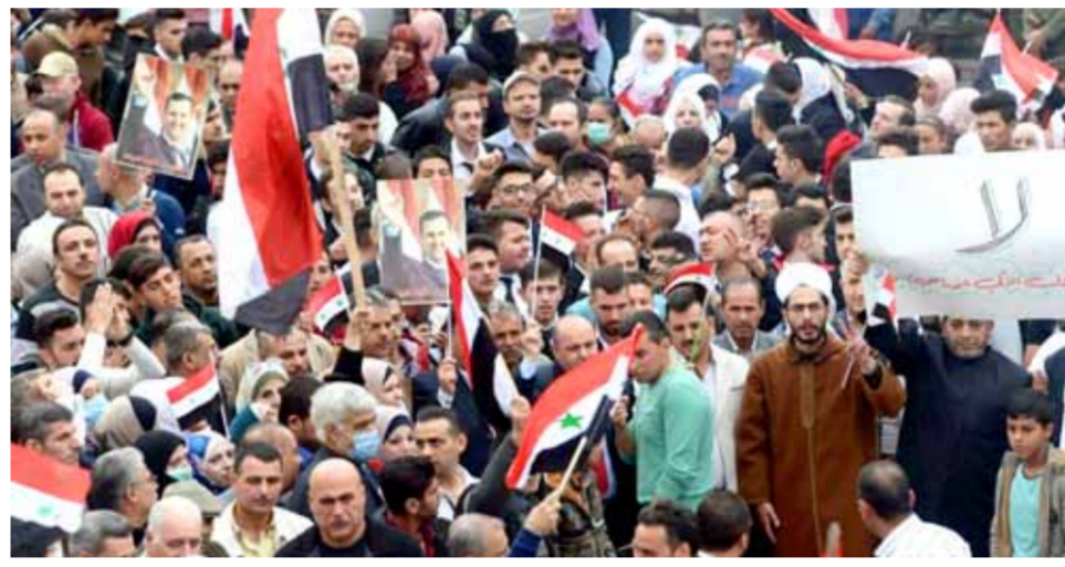
أهالي بلدة تل رفعت يجردون خلال وقفة احتجاجية رفضهم للاحتلال التركي

بأن القيادة الروسية لم تتخل عن مطلب إعادة الحركة للجزء من الطريق الذي يصل حلب باللاذقية. وبالنسبة إلى المساعي الأميركية لتثبيت خطوط تماس مناطق شمال شرق البلاد، أشار المتتبعون، إلى بروز معطى جديد أول من أسس على غاية من الأهمية وله ارتدادات كثيرة في ميادين المعركة في حال حدوثها، وتمثل في سعي القوات الأميركية لإنشاء قاعدة عسكرية في تل تمر لربح أي تحرك تركي باتجاهها، بالإضافة إلى استخدام تعزيزات عسكرية جديدة في باقي المناطق لتأكيد عدم تخلي واشنطن عن دعمها للقوات السورية الديمقراطية-قسد، الانفصالية الموالية لها، على الأقل في المرحلة الحالية.