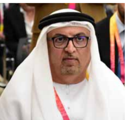
الأمين العام لاتحاد الغرف في مكتب اتحاد الغرف دبي، حميد محمد بن سالم