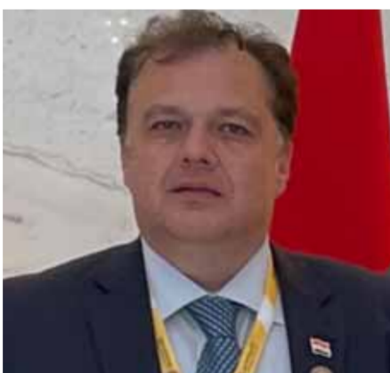
رئيس مجلس الأعمال السوري الإماراتي المشترك، محمد غزوان المصري