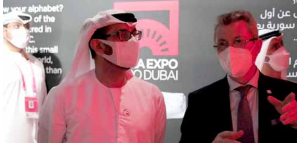
وزير التربية والتعليم الإماراتي مع السفير السوري خلال زيارته جناح سورية في معرض إكسبو ٢٠٢٠ دبي