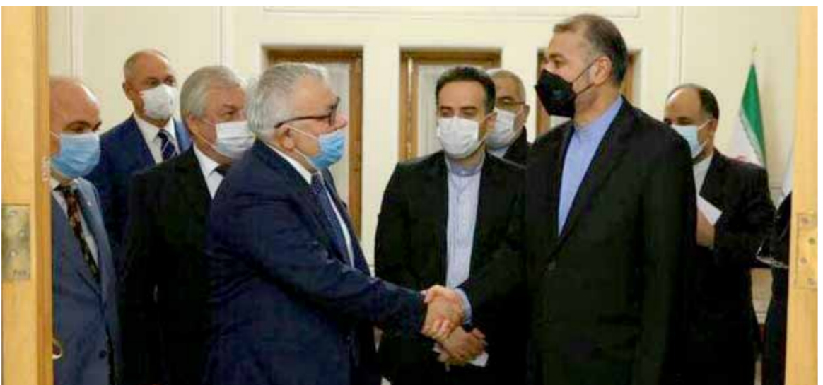
وزير الخارجية الإيراني حسين أمير عبد اللهيان خلال استقباله الوفد الروسي في طهران

موسكو ورفضته أحمد في تصريح لها خلال الندوة الحوارية التي نظمتها «مسد» في مدينة الرقة في ١٦ الشهر الجاري. وأشارت مصادر «الوطن» بأن «مسد» ومن خلفها «قسد» تستهدف من زيارة العاصمة الروسية استباق زيارة الوفد العسكري التقني من وزارة الدفاع الروسية إلى أنقرة للقاء نظرائه الأتراك والتباحث في الأمور العسكرية الخاصة بمناطق شمال شرق وشمال غرب سورية، بناء على مخرجات لقاء الرئيسين الروسي والتركي بموسكو نهاية الشهر الماضي، ولغقت إلى أن وفد «مجلس سورية الديمقراطية» أرجأ زيارته إلى العاصمة الروسية، والتي كانت مقررة في ١٠ الشهر الجاري، بناء على نصائح صاحبة القرار واشنطن ولللقاء المبعوث الأميركي الخاص إلى مناطق شمال شرق سورية إيفان غولديريتش. ويذكر المصدر أن المقترح الروسي بانتشار الجيش العربي السوري في عين العرب، جاء على خلفية ورود أبناء عن حشود عسكرية كبيرة لجيش الاحتلال التركي وميليشياته المسماة «الجيش الوطني» على تقسيم المنطقة الحدودية ومن جهة جرابلس المتناخضة لها لغزو المنطقة. متابعون للوضع شمال وشمال شرق سورية، أوضحوا لـ «الوطن» أن عين العرب التي تعد من أهم مراكز قتل «قسد»، ذات أهمية خاصة للنظام التركي ضمن ما يسميه «المنطقة الأمنة» الحدودية، لافتين إلى أن تدخل الجيش السوري أهد عين العرب عن عاصفة «غصن الزيتون» ومنطلقات «الأمة»، بانتشاره في ريفها المتاخم تركيا، مما درأ غزو جيش الاحتلال التركي لها.