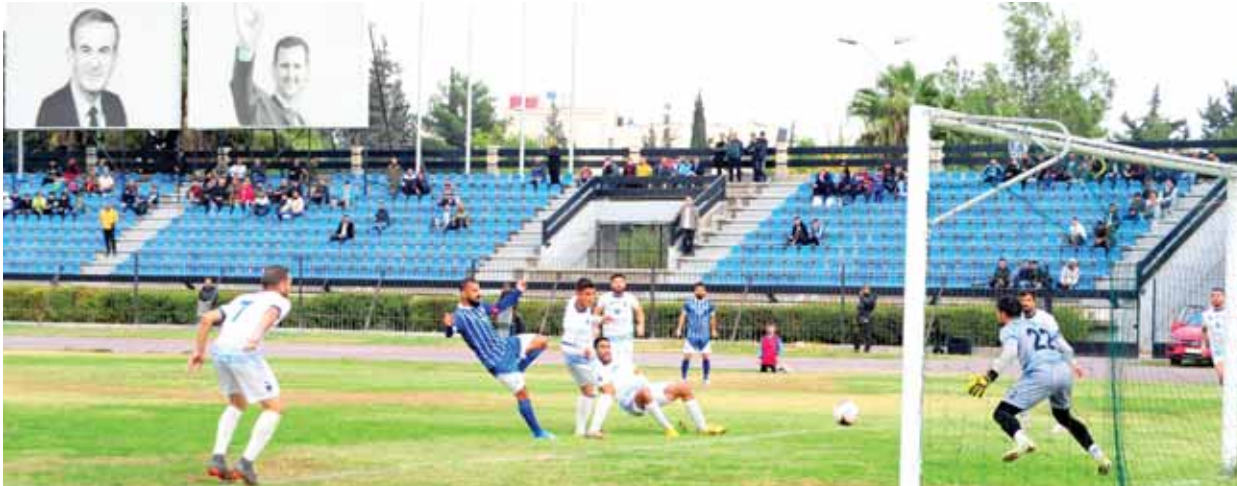
من فوز الفورة على النواعير

حطين لتقديم أفضل ما لديهم، الفوز في المباراة بحاجة إلى جهد كبير وإصرار أكبر لتحقيقه. النواعير يستقبل الشرطة بمباراة التفات المضاعفة كلا الفريقين ويحاولون لجمع منتخبنا وهذا يعرضنا عن التعويض. النواعير لم يخسر على أرضه وهذه نقطة جدر الإشارة إليها، كل أمنيات الشرطة تتلخص بنيل نقطة التعادل في هذه الرحلة.