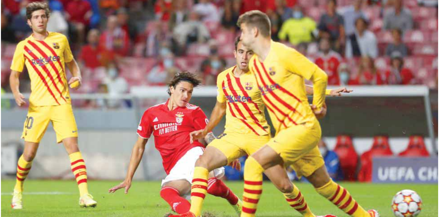
الفوز على بنفيكا يؤهل البرشا

تواصل اليوم وغداً مباريات النسخة السابعة والستين لمباريات دوري أبطال أوروبا، فقام اليوم مباريات الجولة الخامسة من دوري المجموعات الخامسة والسادسة والسابعة والثامنة على أن تقام غداً المباريات الخاصة بالمجموعات الأولى والثانية والثالثة والرابعة. والملاحظ أن ناديين فقط حسموا أمر التأهل من بين الأندية الستة عشر التي تلعب اليوم قبل المباريات وهما البايرن من المجموعة الخامسة واليونيو عن المجموعة الثامنة، ولكن سشهد التأهل لعديد الأندية بموجب نتائج مباريات اليوم دون أدنى شك. جماهير برشلونة تنتظر من مدربها الجديد إكزافي هدية التأهل المشروط بالفوز على بنفيكا الذي حقق فوزاً مثيراً على برشلونة في لقاء الذهاب بثلاثة أهداف دون مقابل، وتلك واحدة من الليالي السوداء المرتبطة بالمدرّب السابق كومان، وبعد الفوز البرشاوي في مباراة التدريب على إسبانيول وهو الظهور الأول للمدرّب إكزافي باتت الجماهير الكاتالونية تنتظر هدية مثالية قد تكون الأعلى خلال عام ٢٠٢١ القادم لبرشلونة وهو التأهل للدور الإقصائية. ومن المباريات القوية تلك التي تجمع تشيلسي مع يوفنتوس في لقاء ثاري للمتصدر الدوري الإنجليزي المطالب بكف شفرة اليوفي المستعصبة عليه منذ ١٢ عاماً.