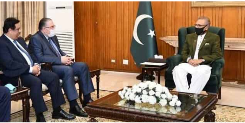
الرئيس الباكستاني خلال استقباله وزير التربية دارم طابع

أرسلت الباكستان رسالة دعم معلنة ووقوفها إلى جانب سورية في حربها ضد الإرهاب، وأكدت على لسان رئيسها عارف علوي أن انتصارات سورية بوجه الإرهاب محل تقدير الجميع.