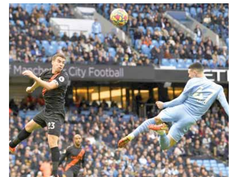
فوز كبير وجدير للسبتي

– غرناطة ٤ ريال مدريد ٤/١ للخاص لويس سواريز (٣٤) وللفان أسينسيو (١٩) ناتشو (٢٥) فينتسيوس (٥٦) مينديزي (٧٦). – إشبيلية ٤ الألبيس ٢/٢ لأولاد أوكاموس