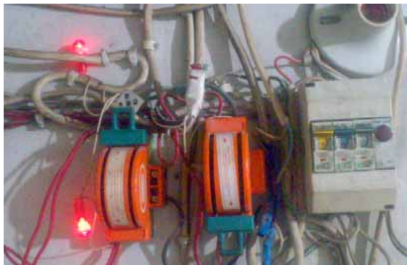
انتعاش سوق الأمبيرات بسبب غياب الكهرباء (عن الانترنت)

وأوضح أن الهيئة تسعى لأن يكون موضوع الدفع الإلكتروني منظماً والأيقع أي أحد سواء الزبون أو التاجر أو حتى شركة الخولي بأي مشاكل، لافتاً إلى أن الهيئة جاهزة لتقديم أي شيء لتشجيع الخدمة.