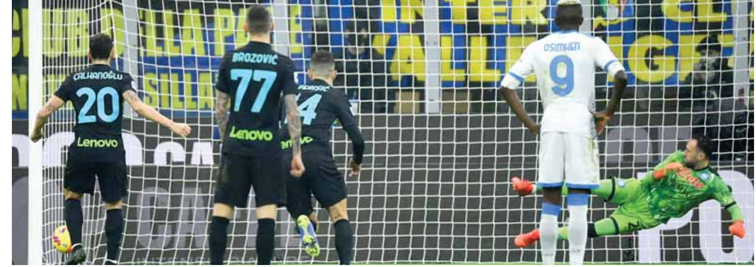
أول هزيمة لنابولي بدأت بهذه الطريقة

لم يطرأ تغيير على صدارة الدوري الإيطالي على الرغم من الخسارة المزدوجة للمتصدر بوصيفه للمرة الأولى هذا الموسم فحافظ إنتر على مركزه الثالث مع فارق أقل من عشرة، ونفادي يوفنتوس السقوط ففاز بركلتي جزاء على لازيو في قمة أخرى لكنه ما زال بعيداً عن مربع الكبار الذي ضم أتالانتا بفوزه الكبير. وفي إسبانيا بدأت حقبة تشافي مع البرشا بفوز يمكن وصفه بالضعف على الجار إسبانيول وعلى مستوى الصدارة تبدلت الأوضاع فأصبحت القمة مدريدية بعد رباعية الريال المرحة وتعزز سوسيداد وقيلبة إشبيلية بالتعاقد، وبخل بيتيس خط المنافسة على مكان بين الأربعة الكبار. وفي فرنسا حقق الباريسي فوزاً جديداً على نانت رغم النقص العددي وجاءت خسارة نيس لترفع الفارق مع أقرب المنافسين من جديد ودخل نيس على خط الوصافة عقب قلب تأخره أمام كليرمون وعلقت الجماهير قمة ليون ومرسيليا المنتظرة بعد دقائق قليلة على انطلاقتها.