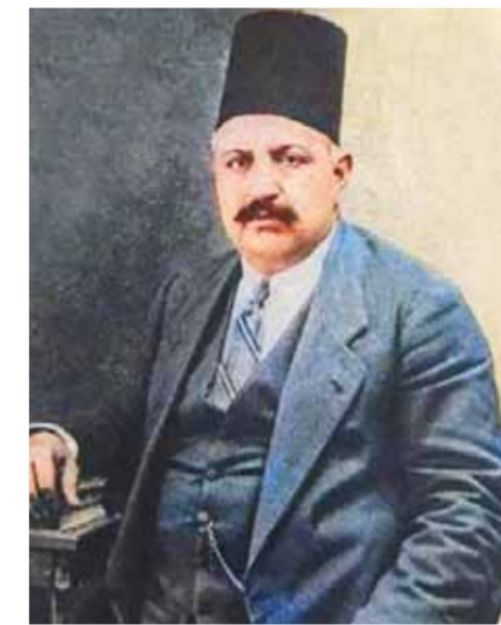
الشيخ علي الدرويش