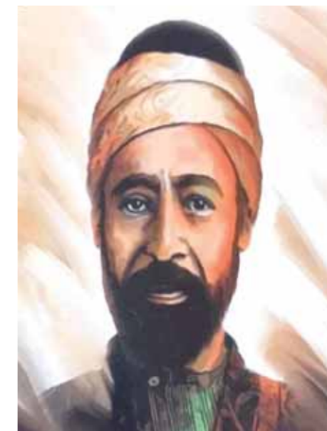
أبو خليل القباني

بعض الكاتبتين رأوا أن القذ جاء من جمال المرأة، ولكن التقاد والعراقين بالشعر عرفوا القدود بأنها منظومات غنائية أنشئت على أعاريض وأحان دينية كبيرة ولائقة وملونة دينياً واجتماعياً وموسيقياً.