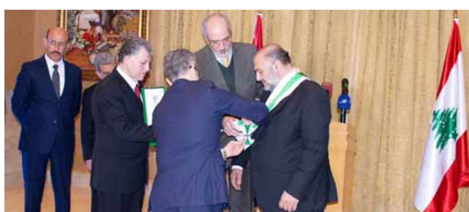
من حفل منح وسام الاستحقاق السوري من الدرجة الممتازة للسفير اللبناني

حررت الأرض المباركة واحدة... بدوره توجه زخيا بخالص المحبة والشكر والامتنان للرئيس الأسد على هذه المنحة الكريمة، متمنياً لسيادته وعائلته موفقاً في الصحة والتوفيق، وقال: «سيشرفني حفل هذا الوسام بكل اعتزاز». واعتبر، أن هذا الوسام سيسهل حافظاً لتابعة الجهد الحثيث والدائم في مواصلة العلاقات والششاطات في الشأن العام للوصول إلى أمن والشعبين، انطلاقاً من الإيمان الراسخ بالتكامل الدائم بين البلدين بما يؤدي إلى مواجهة وإزالة الحصار الجائر وإلى التقدم والانتصار.