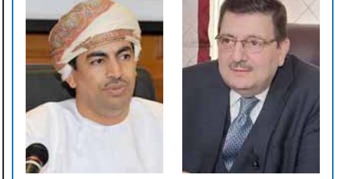
الوزير عبد الله بن ناصر الحارصى الوزير بطرس الحلاق

بحث وزير الإعلام بطرس جرجس الحلاق، مع نظيره العماني عبد الله بن ناصر الحارصى أمس، سبل تطوير التعاون الإعلامي بين البلدين في جميع المستويات. وتركزت المحادثات عبر قناة اتصال عن بعد، على تعزيز التعاون في مجالات التبادل الإخباري والتدريب الإعلامي والإنتاج الدرامي المشترك والتعاون التقني والفني، إضافة إلى توقيع اتفاقيات بين المؤسسات الإعلامية السورية ومثيلاتها العمانية وتبادل زيارات الوفود الإعلامية بين البلدين. وأشار الوزيران حسب «سانا»، إلى عمق العلاقات الثنائية والتاريخية بين البلدين وضرورة التنسيق المشترك في مواجهة الأخبار والحملات الإعلامية الزائفة التي تستهدف المجتمعات عبر تشويه الحقائق وقلب المقاميم. وأكد الجانبان أهمية تنفيذ ما جرى الاتفاق عليه خلال الاتصال، والعمل على تنسيق المواقف الإعلامية في إطار التعاون الإقليمي والدولي. تجدر الإشارة إلى أن الوكالة العربية السورية للأنباء «سانا» ووكالة الأنباء العمانية وقعتا في ٢٠٠٧ مذكرة تفاهم للتعاون الإخباري، وفي مجال التدريب وتبادل الوفود الإعلامية.