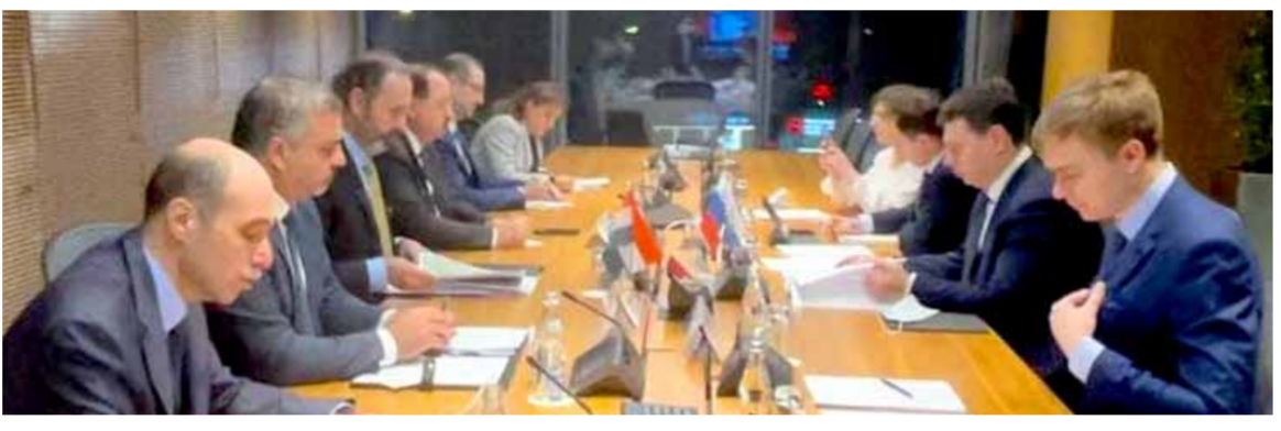
وزير شؤون رئاسة الجمهورية منصور عزام ونائب رئيس مجلس الوزراء الروسي رئيس اللجنة عن الجانب الروسي بوري بوريسوف خلال المباحثات في موسكو

ياغي، والأمين العام لرئاسة مجلس الوزراء قيس خضر، وعضو السعيد من رئاسة الجمهورية، وسفير الجمهورية العربية السورية في روسيا رياض حداد. وعقد الوفد السوري، أول من أمس، جلسة محادثات تمهيدية في مبنى وزارة التنمية الاقتصادية في موسكو برئاسة الوزير عزام، وفلاديمير بيليتشوف نائب بوري بوريسوف في متابعة شؤون اللجنة المشتركة السورية - الروسية للتعاون الاقتصادي والتجاري والعلمي والفني، وشائب وزير التنمية الاقتصادية، حيث شارك في هذه الاجتماعات المسؤولون المعنيون عن ملفات التعاون في كل من وزارة التنمية الاقتصادية والجهات الروسية الأخرى المعنية. وتم التطرق خلال هذه الاجتماعات التمهيدية إلى جميع الاتفاقات في مجال التعاون المشترك، ولاسيما ما يتعلق منها ببعود توريد القمح الروسي إلى سورية، بالإضافة إلى متابعة ملف الاستثمارات في قطاع النقل والقطاع الصناعي وكذلك في قطاع التكنولوجيا والمعلوماتية. كما عقد الوفد السوري أول أمس أيضاً، جلسة محادثات مع الشركات الروسية الموردة للقمح والذرة، ثم خلالها مراجعة جدول التوريدات ومواعيد وصولها ومدى مطابقتها لبيود العقود الموقعة حيث أعرب الجانبان عن الارتياح الكبير لسير إجراءات التوريد، وتنفيذ العقود، وتم وضع برنامج عمل للمرحلة المقبلة لمتابعة آفاق التعاون المشترك على هذا الصعيد.