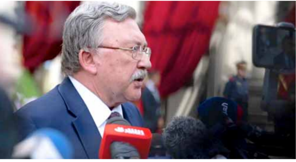
مندوب روسيا الدائم لدى المنظمات الدولية في فيينا

تزامناً مع إعلان التلفزيون الإيراني أمس انتهاء محادثات اليوم الثاني من الجولة الحالية من المفاوضات، أفادت الوكالة الدولية للطاقة الذرية، بأن إيران بدأت تشغيل مجموعة أجهزة طرد مركزي متطورة من طراز «آي آر-6» في منشأة فوردو لتخصيب اليورانيوم عند مستوى يصل إلى 20 بالمائة. وقالت الوكالة الدولية للطاقة الذرية التابعة للأمم المتحدة في بيان لها: «إنها تحققت أول أمس الثلاثاء من أن إيران قامت بضخ سادس فلوريد اليورانيوم المحضب بدرجة تصل إلى 20 بالمائة في سلسلة تتألف من 166 جهاز طرد مركزي من طراز «آي آر-6» في فوردو بهدف رفع درجة نقائها إلى 20 بالمائة». إعلان الوكالة الدولية للطاقة الذرية استعدي قلقاً روسيا، وأعلن مندوب روسيا الدائم لدى المنظمات الدولية في فيينا، ميخائيل أوليانوف، أن بلاده تشعر بقلق من بدء إيران تخصيب اليورانيوم في منشأة فوردو النووية بنسبة تصل إلى 20 بالمائة. وقال أوليانوف، في تصريح صحفي أدلى به أمس: إن بلاده تشعر بقلق من الإجراءات التي اتخذتها طهران، معتبراً أنها «وصلت إلى نقطة بعيدة