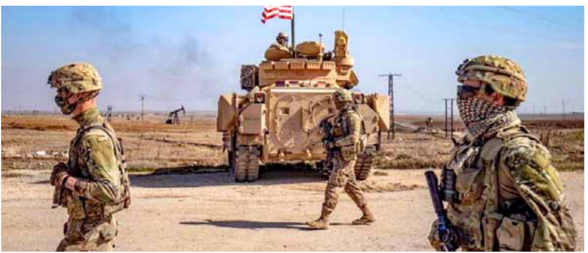
جنود لجيش الاحتلال الأمريكي بالقرب من قاعدة «كونيكو» غير الشرعية

تلبية لدعوة من الجمهورية الإسلامية الإيرانية يصل إلى العاصمة طهران مساء اليوم وفد سوري رسمي برئاسة وزير الخارجية والمغتربين فيصل المقداد. وعلمت «الوطن» من مصادر مطلعة في طهران، أن الوفد يضم إلى جانب المقدم نائب وزير الخارجية والمغتربين بشار الجعفري، حيث سيلتقي الوفد بكبار المسؤولين الإيرانيين. وحسب المصادر فإن زيارة الوفد التي تستمر ليومين ستبحث في تعزيز العلاقات الإستراتيجية التي تجمع البلدين. وهذه هي الزيارة الثانية للمقداد إلى إيران منذ توليه منصب وزارة الخارجية، والأولى له في ظل الإدارة الإيرانية الجديدة برئاسة الرئيس إبراهيم رئيسي. وزير الصناعة والمناجم والتجارة رضا فاطمي أمين، حيث التقى كبار المسؤولين السوريين وشارك في افتتاح المعرض الإيراني التخصصي الذي انطلق في مدينة المعارض في التاسع والعشرين من الشهر الفاتح. كما استقبلت دمشق في التاسع من تشرين أول الفائت وزير الخارجية الإيراني حسين أمير عبد اللهيان والتقى الرئيس بشار الأسد وجرى بحث العلاقات الإستراتيجية بين البلدين والجهود المشتركة لتعزيمها، من خلال وضع برامج عمل تنفيذية لتطوير وتوسيع مجالات التعاون في كل المجالات التي تخدم مصلحة الشعبين الصديقين وخاصة في المجال الاقتصادي والتجاري. كما تم بحث التطورات الميدانية على الأرض في سورية، حيث شدد الرئيس الأسد على الاستمرار في تحرير كل الأراضي من الإرهاب وإنهاء أي وجود أجنبي غير شرعي عليها. عبد اللهيان وفي تصريح صحفي نقلته وكالة «فارس» الإيرانية وقتها، كشف عن زيارة سيقوم بها وزير الخارجية والمغتربين فيصل المقداد إلى طهران، معتبراً بأن هذا يؤكد عزم وزارتي خارجية البلدين على تنفيذ إرادة ونيات رئيسي البلدين، مبيناً أن الجانبين يصدت تنفيذ الاتفاقات الموقعة بينهما.