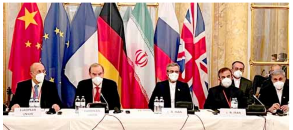
من جولة المفاوضات الأخيرة حول الملف النووي الإيراني في فيينا (عن الانترنت)