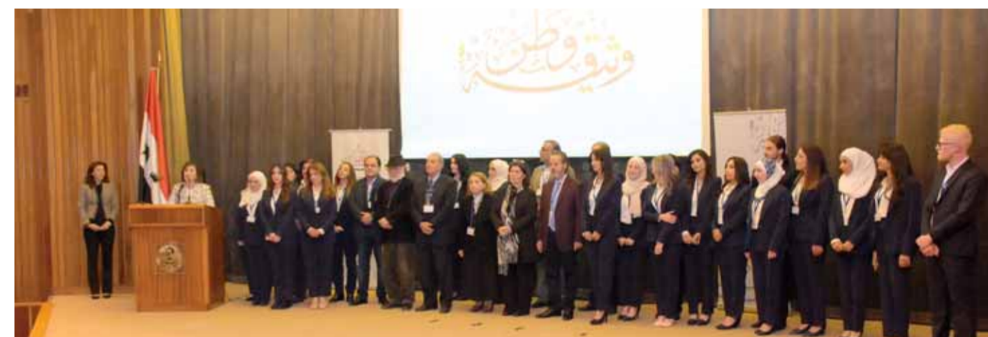
مجلس أمناء «وثيقة وطن» مع لجنة التحكيم والمتطوعين في «الوثيقة» من كافة المحافظات