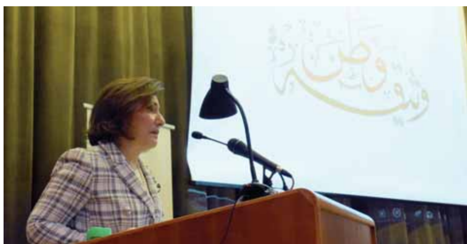
الدكتور بثينة شعبان تلقي كلمتها في ختام الدورة الثالثة من «هذي حكايتي»