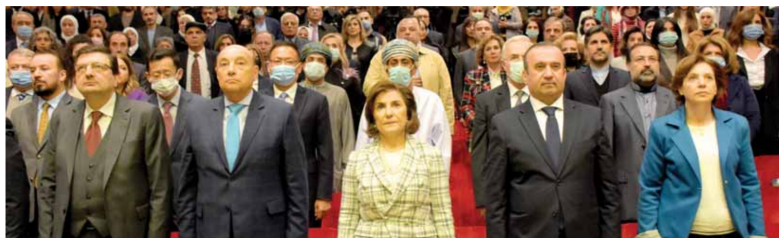
جانب من الحضور الرسمي