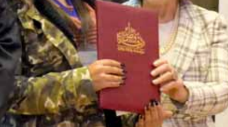
تسليم الجوائز لـ٩ فائزين بـ«هذي حكايتي» من ثلاث فئات عمرية

كلما سرنا خطوات في هذا المشروع كلما رأينا أن الطريق أصبح أطول لأنه هو مشروع للبلد بكل أنحاءه وبكل مناطقه، لافتة إلى أن سورية تمتلك غنى مائلاً في الآثار وفي كل المجالات وما يخص موضوع التنقل وغيرها من الموضوعات ذات الاهتمام المشترك، والتي تصب في مصلحة البلدين وتؤدي لتفعيل الاتفاقيات الموقعة بين البلدين. وبخصوص متابعة التفاهات التي جرى التوصل إليها مؤخراً عقب زيارة الوفد الوزاري اللبناني إلى سورية في الرابع من أيلول الفاتت وما يخص الإجراءات الفنية الخاصة بتمرير الغاز المصري والكهرباء الأردنية إلى لبنان عبر الأراضي السورية عقب موافقة الحكومة السورية على هذا الأمر، عبر خوري عن أمله في متابعة الخطوات التي بدأت، مجدداً التأكيد على أن الأجواء إيجابية أيضاً في هذا المجال.