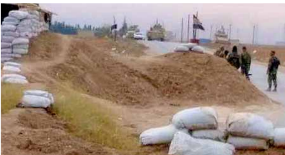
حاجز للجيش السوري يعترض رتلًا للاحتلال الأميركي في قرية تل الذهب بريف القامشلي

حين كبد إرهابيي «الفتح المبين» خسائر بشرية وعسكرية في محيط بلدات فيلق وفيلق وبييتن في جبل الزاوية بريف إدلب الجنوبي جنوب طريق عام حلب - اللاذقية والمعروف بطريق «M4». بدورهم داهم إرهابيو الاحتلال التركي، أمس، بلدة الدوغانية في ريف تل أبيض الجنوبي بمحافظة الرقة، واطفوا الرصاص تجاه النساء والأطفال ترهيبهم، وذلك على خلفية إقامة الأهل في مجلس عزاء برحيل الشيخ رضوان الطحان شيخ قبيلة النعيم في سورية. وذكرت مصادر أهلية من الدوغانية لـ«الوطن»، أن ٧ سيارت تحمل عشرات المسلحين مما تسمى «الشرطة العسكرية» التابعة للتنظيمات الإرهابية الموالية للاحتلال التركي، دامت ظهر أمس الثلاثاء القرية وقامت بإطلاق الرصاص ترهيب النساء والأطفال، لافتة إلى أنه تم أيضاً إطلاق الرصاص بشكل مباشر على أحد أبناء القبيلة، وتفشيت عدد من المنازل بسبب فتح مجلس عزاء وتقبل التعازي برحيل الشيخ رضوان الطحان يوم أول من أمس الإثنين، موضحة أن عملية المداومة تهدف إلى اعتقال من أقاموا مجلس العزاء. وبعدما وصفت المصادر ما قام به مرتزقة الاحتلال التركي بأنه «حالة إرهابية»، أكدت أن ما قام به هؤلاء لم يرهب أهالي القرية، لافتة إلى أنه تم أيضاً إقامة مجلس عزاء برحيل الشيخ الطحان في داخل مدينة تل أبيض المحتلة. ونشرت التنظيمات الإرهابية تهديدات عبر حساباتها على مواقع التواصل الاجتماعي تتوعد فيها كل من يقم مجلس عزاء للموالين للدولة السورية مشددة على أنها ستعمل على «هدم مجلس العزاء فوق رأس من يقمه ورأس من يخرج وراءه».