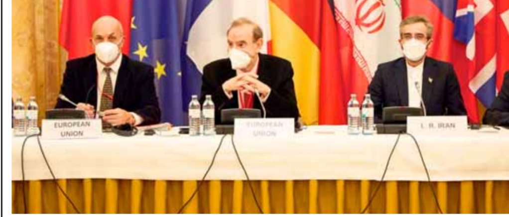
من جولة المفاوضات الأخيرة في فيينا حول الاتفاق النووي الإيراني

سيمهً الطريق سريعاً لاتفاقية جيدة، معتبراً أن المسار الذي اتبعته إيران خلال التفاوض كان مساراً ناجحاً، وأن بلاده استطاعت تحقيق تقدم جيد. على خط مواز أعلن وزير الخارجية الأميركي أنتوني بلينكن أمس أن الولايات المتحدة تحضر بشكل نشط مع حلفائها بديل للاتفاق النووي الإيراني في حال فشلت مفاوضات فيينا. وقال بلينكن خلال مؤتمر صحفي في العاصمة الإندونيسية: «قريباً يفوت الأوان، ولم تخترط إيران بعد في