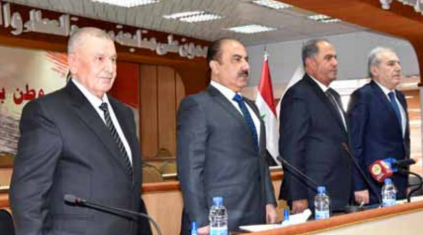
الهلال والقادي يتوسطان سباعي وعزوز خلال أعمال اجتماع المجلس المركزي لاتحاد نقابات العمال

الأخير من العام، مشيراً إلى أن الاتحاد شارك في إقرار إعادة هيكلة بوليصات التأمين الصحي للعاملين ورفع قيمة خدماتها ويعمل لإنجاز بوليصات التأمين الصحي للمتقاعدين من العمال قريباً.