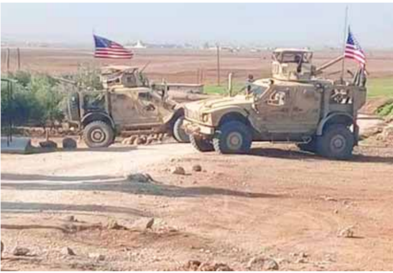
مدرعات لجيش الاحتلال الأمريكي التي اعترضها حاجز الجيش السوري بريف تل تمر قبل يومين

«قسد» أكثر إلى الحوار مع الحكومة السورية الشرعية في دمشق، قال خليل: «هذا موضوع مختلف ولا علاقة لهذا بذاك. هذه خلافات بين «البشمركة» و«قسد»، أما الحوار مع الدولة السورية فلم يتوقف، ولكن مطالب «قسد» هي مطالب غير محقة وتعجزية في هذه الظروف، لأنه لا يحق لأي أحد أن يعمل على تقسيم أي جزء من الأراضي السورية التي هي وحدة متكاملة، ولا يوجد جزء مجزء من هذه الأراضي، ومطالبهم في هذا الجانب لا يمكن تحقيقها ولا بأي شكل من الأشكال.