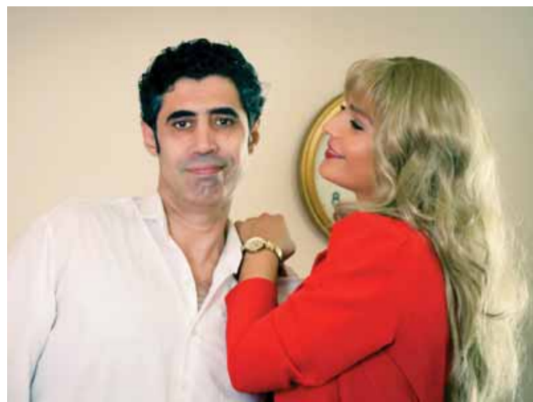
من مسلسل «بعد عدة سنوات»