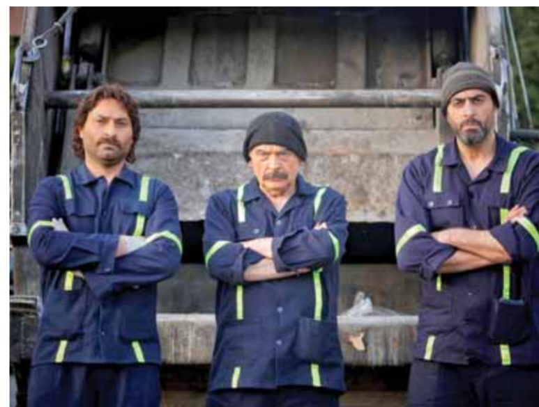
من مسلسل «علي صفيق صاخر»