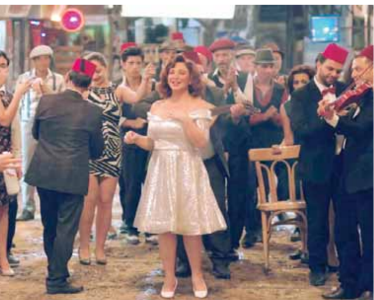
من مسلسل «شارع شيكاغو»