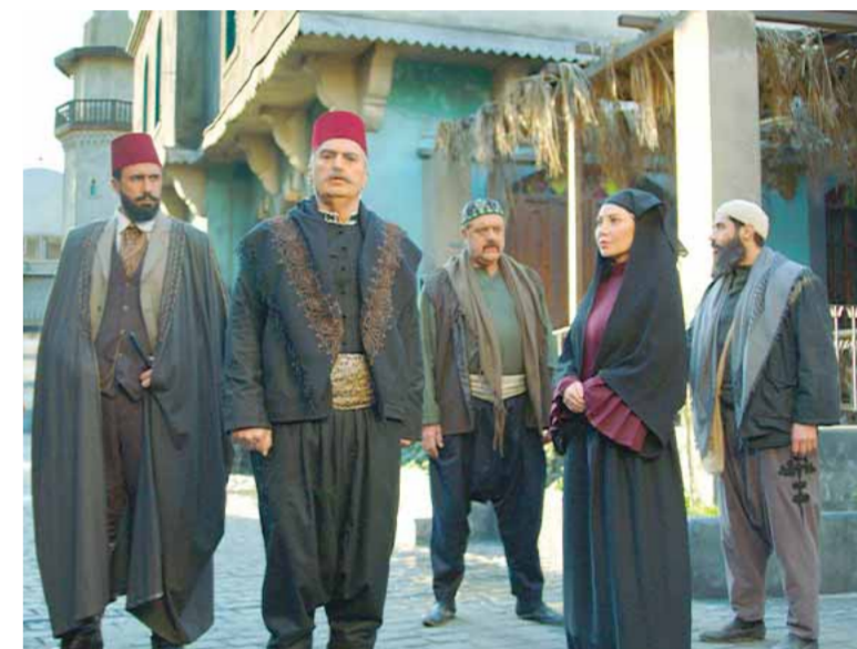
من مسلسل «حارة القبة»

ولنعترف أن معضلة الدراما الرئيسية كانت تكمن في غياب السياسات التسويقية، إلى جانب إنتاج بعض الأعمال وفق ميزانيات متواضعة تؤثر سلباً في جودتها، والأهم هو عدم وجود نصوص لها علاقة بالمرحلة والمناسبة لحالة التسويق. فالانتشار البطيء يكون عادةً بسبب المستوى السطحي الذي تعتمد عليه بعض شركات الإنتاج التي تغلب المصالح والحسوبيات في اختيار الممثلين غير الأكفاء، اعتقاداً منها أن الجمال وحده يسوق للعمل. وكما كل عام، بسطت الدراما السورية سيطرتها على الشاشات العربية في شهر رمضان المبارك، ورغم قلة المسلسلات خلال الموسم الحالي إلا أنها نجحت في استقطاب ٤٧ شاشة تلفزيونية خلال الشهر الكريم، امتدت من الخليج إلى المحيط. وكان من اللافت أن معظم المسلسلات السورية عرضت عبر قنوات محلية وعربية باستثناء ما أنتجته المؤسسة العامة للإنتاج والتوزيع والتي بقيت بمعظمها ضمن الإطار المحلي.