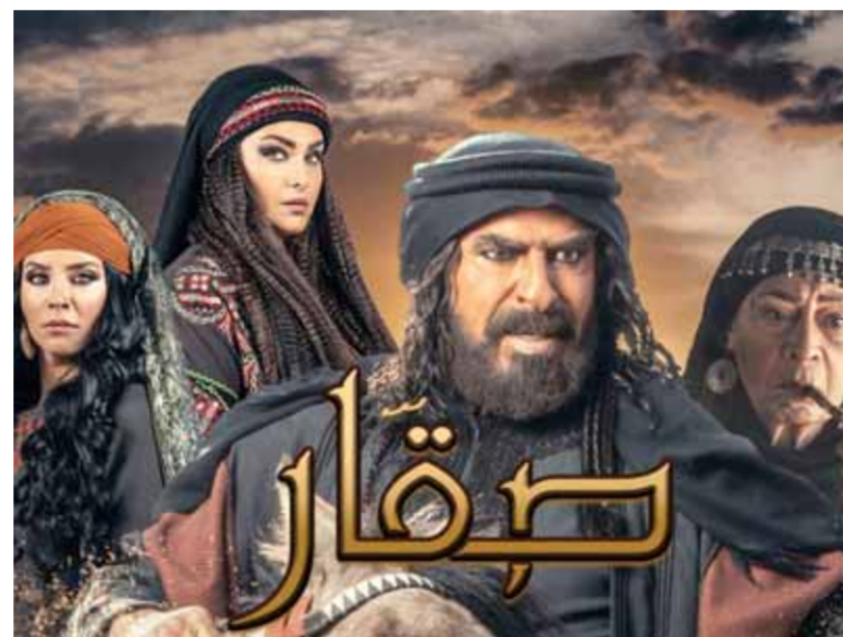
من مسلسل «صقار»