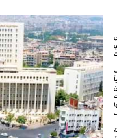
المصرف الذي يتعاملون معه، على تجاوز سقف السحب اليومي بناء على طلب خطي