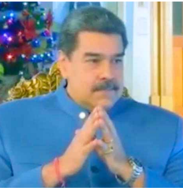
الرئيس الفنزويلي نيكولاس مادورو

وتابع: «نحن نحب سورية كثيراً، والشعب السوري عانى كثيراً خلال السنوات الـ١١ الماضية، وعرف كيف يصمد، وكيف ينتصر، والجيش العربي السوري، ومع الشعب السوري الموحد، والرئيس الأسد، سوف ينهضون بسورية من جديد، وسوف يحررونها كاملة».