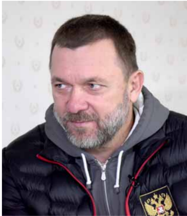
رئيس لجنة الصداقة الروسية - السورية نائب رئيس لجنة الدفاع في مجلس الدوما الروسي ديمتري سابلين خلال لقائه مع «الوطن»

بصورة فعالة مواقفنا في هذا المجال». وأشار إلى سعي الوفود الروسية للوقوف إلى سورية في هذه الفترة من السنة، ليقدموا المبادرات للأطفال السوريين، وقال: «عندما نقول تقدم المحبة نقصد أيضاً الأطفال الروس الذين شاركوا في تحضير الهدايا لنظرائهم السوريين، حيث شارك الأطفال في موسكو بتقديم هذه الهدايا المقدمة من القلب هي بمثابة جزء من المحبة والحفاوة الروسية وهذا أمر مهم جداً».