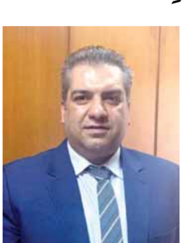
السحب اليومي بالدفع الإلكتروني، فلا يوجد سوق للمدفوعات الإلكترونية.