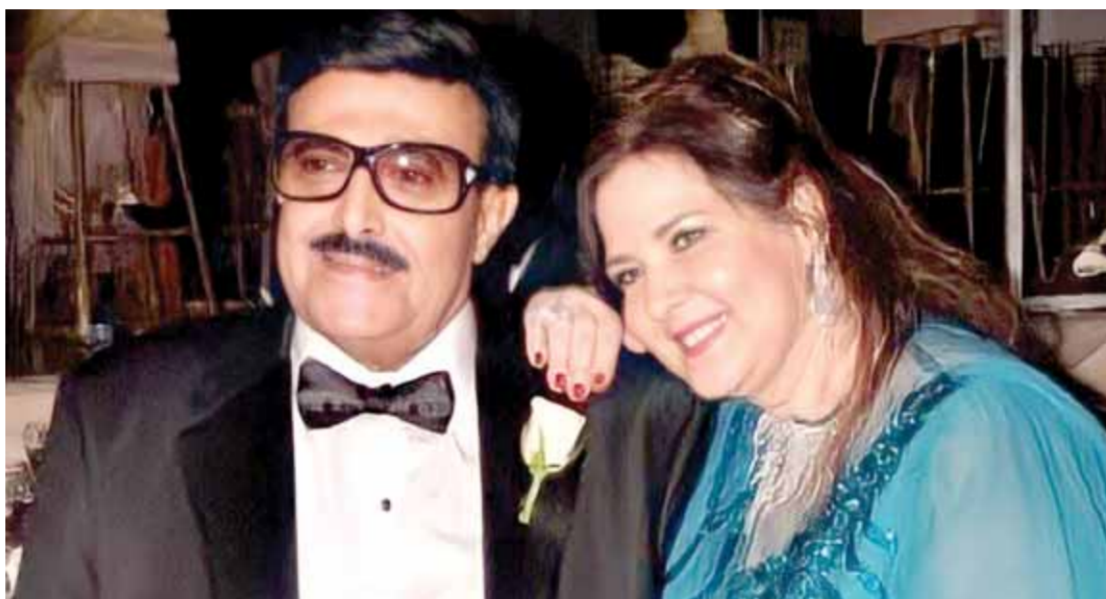
دلال عبد العزيز وسمير غانم