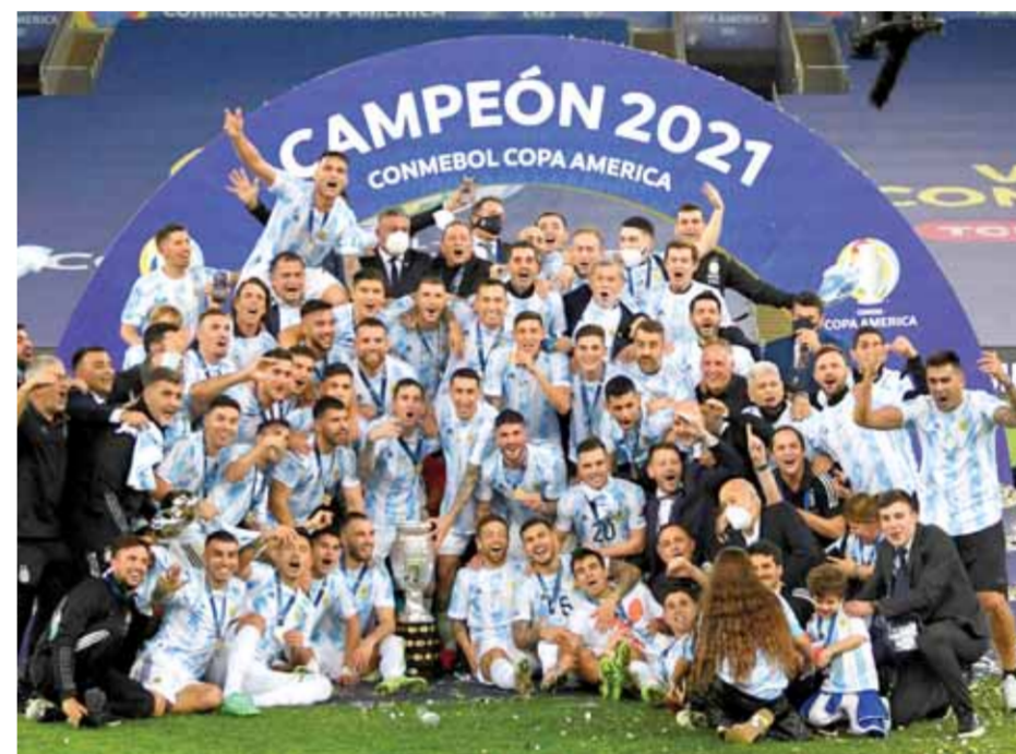
راقصو التانغو واللقب الخامس عشر

وإذا كان بلوغ اللاروخا الإسباني نصف النهائي متوقفاً جاء مستحقاً وعن جدارة على الرغم من أنهم احتاجوا إلى ركلات الترجيح في الدورين الآخرين من البطولة، فقد قدم الأتزوري بطولة للمكزي ونجح بتحقيق خمسة انتصارات متتالية للمرة الأولى بتاريخ مشاركته في بطولة كبرى، ففاز بالدور الأول على تركيا وسويسرا بالنسبة ذاتها (٣/٣) وعلى ويلز بهدف وتلقى الهدف الأول في دور الـ١٦ أمام النمسا يوم فاز ١/٢ بعد وقتين إضافيتين. وأبعد المنافس القوي البلجيكي من ربع النهائي بنتيجة ١/٠ التي ليصطدم باللاروخا الإسباني ففعلوا ١/١ بعد ١٢٠ دقيقة لتتيسر ركلات الترجيح للأزرق (٢/٤) وفي النهائي واجه أسود إنكلترا الثلاثة الذين سجلوا بدورهم إنجازاً غير مسبوقة بالوصول إلى مباراة التتويج تحت قيادة المدرب ساوثويتش الذي أعاد الهبة لمنتخب أم الكرة وذلك جاء النهائي مثالياً وانتهى كذلك بالتعادل ١/١ واستمر عهد التمديد واستمرت ركلات الترجيح مرة أخرى