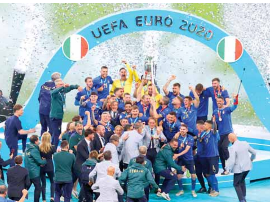
الأتزوري استعاد العرش الأوروبي بعد ٥٣ عاماً

أول مانشستر سيتي وعلى الملعب الألمبي في نصف نهائي من دور الـ١٦ وربع النهائي بالفوز عليها ٢/٠ صفر وفي المباراة النهائية وقد تخطى في أدوار الإقصاء مونشن غلادباخ وديورتسند الأمانتين وأبعد سان جيرمان في نصف النهائي بالفوز عليه ١/٢ في باريس ٢/٠ صفر في مانشستر، على حين تلقى تشيلسي هزيمة واحدة بدورة وكانت أمام بورتو بهدف في لندن بعدما فاز البلوز ذهاباً بهدفين وفي نصف النهائي أبعاد ريال مدريد زعيم المسابقة بعدما فرض عليه التعادل ١/١ في مدريد وفاز عليه في ستامفورد ٢/٠ صفر، ويحسب للمدرب الألماني توماس توخيل الجزء الأكبر من هذا الإنجاز بعدما تسلم المهمة مطلع العام فأضحى الفريق لا يفقر خلال ٦ أشهر إلى النهائي وهما ساوباولو بالتعادل معه ١/١ ثم الفوز ٣/٠ صفر والتتويج مينيرو بالتعادل معه صفر/صفر ١/١ وتاهل بفضل الهدف خارج الأرض.