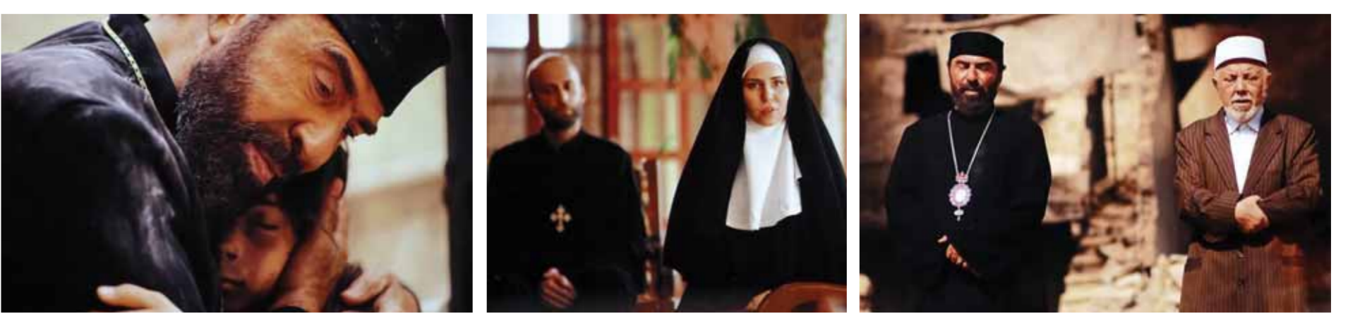
لقطات من فيلم «المطران»