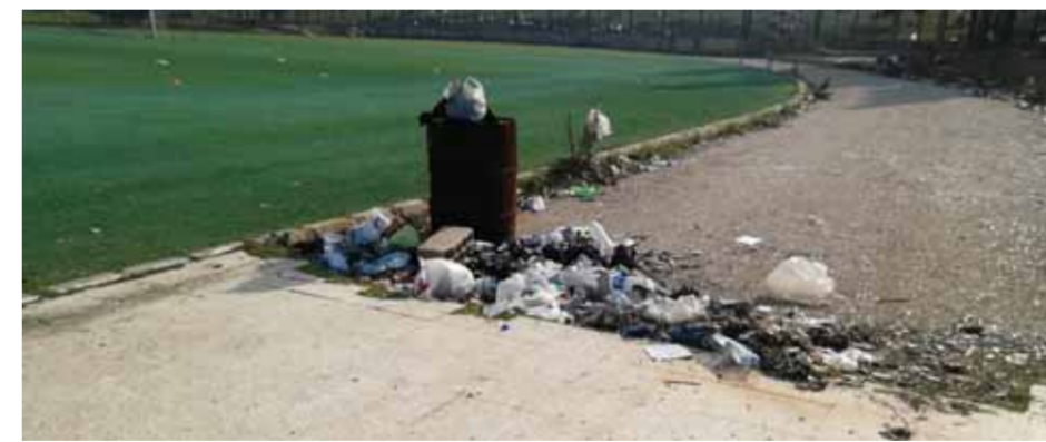
قمامة في ملعب حمص