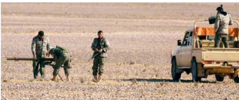
إرهابيو «مقاوير الثورة» يثربون مع قوات الاحتلال الأميركي في قاعدة التفغ غير الشرعية

إحداث عمق جديد لها عبر هذه التعزيزات بعد انسحابها من العراق بهدف إلى تغيير قواعد الاشتباك في المنطقة، وجر الجيش العربي السوري لاشتباك مباشر معها. مصادر «الوطن» أشارت إلى محاولات التنشيط القائمة على قدم وساق لخلايا تنظيم داعش، والتي يقف وراءها الاحتلال الأميركي بهدف تيرير استمرار وجوده غير الشرعي على الأراضي السورية. وأشارت إلى قيام ميليشيات «قسد» مؤخراً بإطلاق سراح العشرات من قيادات داعش المحتجزين في مخيم الهول»، في حين جرى نقل المئات من الدواعش من داخل الأراضي العراقية إلى منطقة التفغ في البادية الشرقية والتي يسيطر عليها الاحتلال الأميركي، والقيام بما يمكن تسميته «إعادة تدويرهم» عبر تسليحهم وتدريبهم وتأمين الغطاء اللازم لعملياتهم الإرهابية، لافتة إلى أن هذا ما كشفته الاعتداءات الإرهابية الأخيرة والتي انطلقت جميعها من منطقة التفغ أو ما يعرف منطقة الـ«٥٥٥». وعلمت «الوطن» بأن الجيش يستعد لشن عملية عسكرية في منطقة البادية، حيث تنشط خلايا داعش، ووصلت تعزيزات عسكرية ضخمة لقوات الجيش إلى منطقة السخنة في عمق البادية. وتفيد معلومات «الوطن»، بأن عيسى، بهدف توسيع نطاق نفوذ نظام اردوغان في المنطقة بذرائع وأمية لحاكم السيطرة على شريانا الرئيسي، وهو طريق «M4» الذي يربط السخنة بحلب عبر الرقة ويعبر بمحاذاة البلديتين الإستراتيجيتين، وبما يساهم في تقطيع أوصال مناطق شرقي الفرات ويعزلها عن مناطق غربي الفرات.