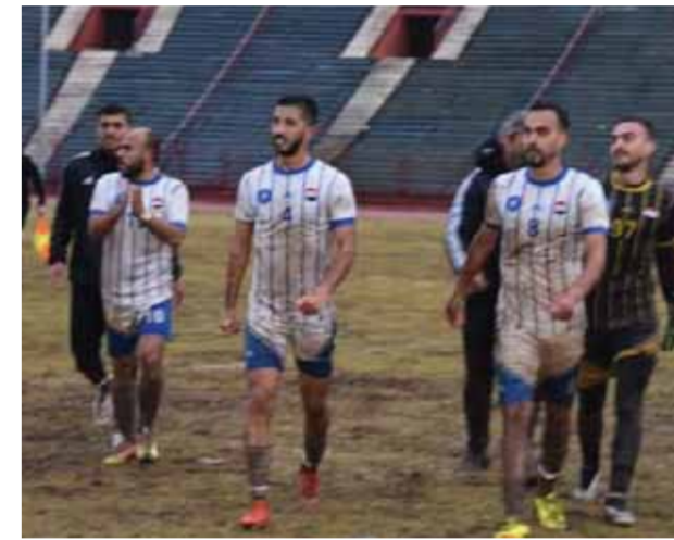
ملعب المدينة الرياضية