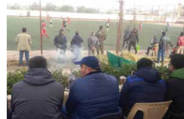
ترجيبة في ملعب عرطوس