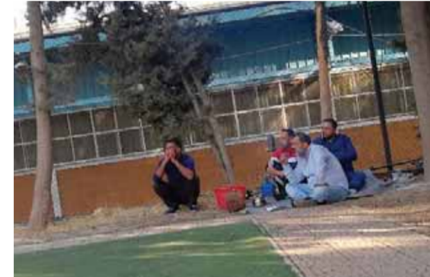
سيران في ملعب الفيحاء