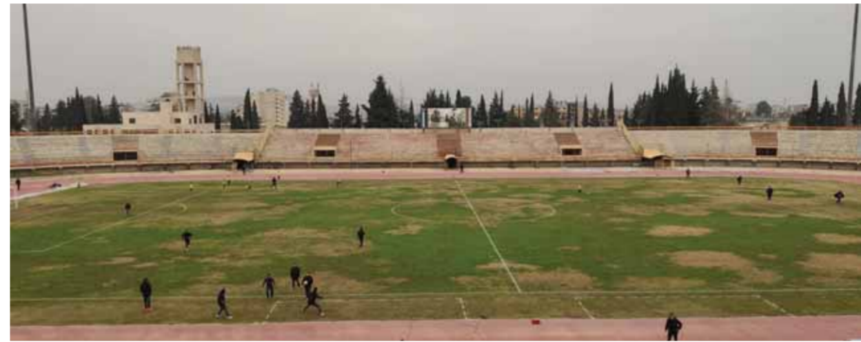
ملعب حماة البلدي