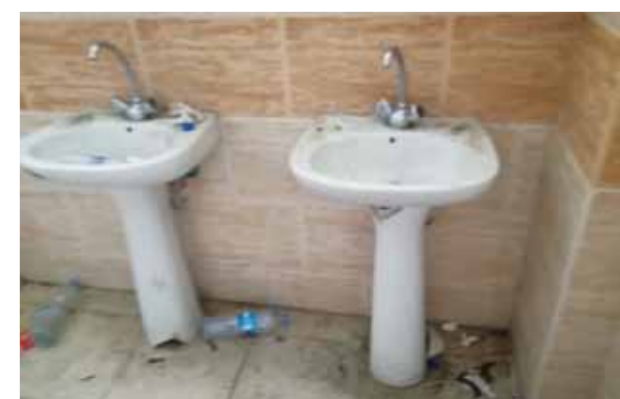
المرافق الصحية في خير كان