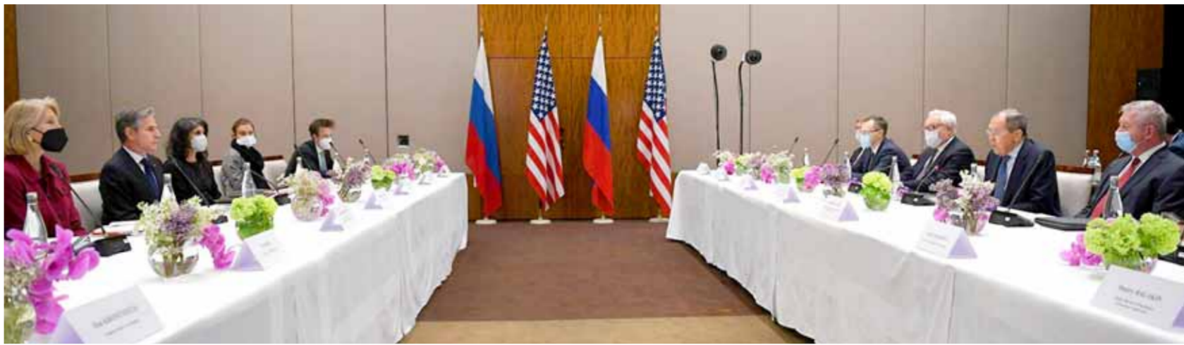
من المحادثات التي جرت أول أمس في مدينة جنيف السويسرية بين وزير خارجية روسيا سيرغي لافروف ونظيره الأمريكي أنتوني بلينكن (من اليمين)

أكد وزير الخارجية الروسي فلاديمير بوتين هاتفياً مع رئيس الوزراء الأمريكي جو بايدن بشكل منفصل اليوم، الجمعة (١٩ كانون الثاني/يناير)، أن موسكو لا تعتزم شن هجوم نووي على أوكرانيا، مؤكداً أن روسيا لن تغزو أوكرانيا. وأضاف بوتين أن روسيا لن تشر قوات «الناو» بالقرب من حدودها مع أوكرانيا، مؤكداً أن نشر قوات «الناو» بالقرب من حدودها سيؤدي إلى أخطر العواقب. وقد أعلن بوتين خلال محادثته مع بايدن أن روسيا لن تشر قوات «الناو» بالقرب من حدودها مع أوكرانيا، مؤكداً أن نشر قوات «الناو» بالقرب من حدودها سيؤدي إلى أخطر العواقب. وأضاف بوتين أن روسيا لن تشر قوات «الناو» بالقرب من حدودها مع أوكرانيا، مؤكداً أن نشر قوات «الناو» بالقرب من حدودها سيؤدي إلى أخطر العواقب. وقد أعلن بوتين خلال محادثته مع بايدن أن روسيا لن تشر قوات «الناو» بالقرب من حدودها مع أوكرانيا، مؤكداً أن نشر قوات «الناو» بالقرب من حدودها سيؤدي إلى أخطر العواقب. وأضاف بوتين أن روسيا لن تشر قوات «الناو» بالقرب من حدودها مع أوكرانيا، مؤكداً أن نشر قوات «الناو» بالقرب من حدودها سيؤدي إلى أخطر العواقب.