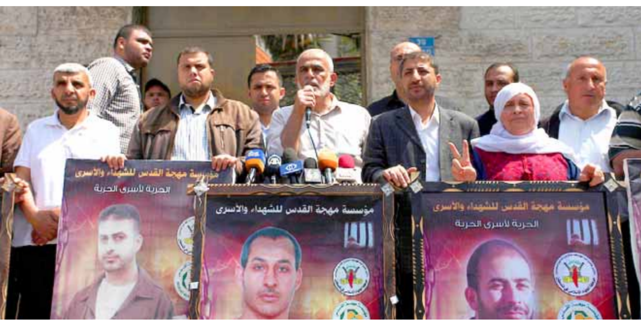
مؤسسة مهجة القدس في الضفة الغربية مع أسر المعتقلين الفلسطينيين في سجون الاحتلال الإسرائيلي (من اليمين)

مع مواصلة الجيش الإسرائيلي منع زيارته إلى المعتقلين في سجون الاحتلال الإسرائيلي، اعتقلت قوات الاحتلال الإسرائيلي في الضفة الغربية عدداً من الفلسطينيين، وأطلق النار صوب أراضٍ زراعية شرق خان يونس. وقد أعلن مسؤولو الاحتلال الإسرائيلي أنهم اعتقلوا عدداً من الفلسطينيين، وأطلقوا النار صوب أراضٍ زراعية شرق خان يونس. وأكد أن الاعتقالات والنيران صوب الأراضٍ الزراعية هي جزء من سياسة القمع التي تتبعها قوات الاحتلال الإسرائيلي.