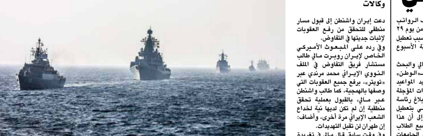
من المناورة البحرية بين إيران وروسيا والصين الموسومة بـ«الحزام الأمني البحري ٢٠٢٢»

الذي تقل عن مسؤول كبير في الاتحاد الأوروبي، أنه قلق من أن يفوق بطء وتيرة المحادثات إلى عدم التوصل لاتفاق جيد في فيينا. وتابع الدبلوماسي الروسي: «التشويق الزمني يعتمد على المشاركين في محادثات فيينا، ليس كذلك؛ التوقيت مهم للغاية في هذه الحالة، لكن لا ينبغي أن يكون العامل الرئيس الذي يحدد نتيجة المفاوضات حول مستقبل الاتفاق النووي، وإذا لزم الأمر يجب على المفاوضات تسريع عملهم». بالعنوان «توسيت» رد فعله على مراسل صحيفة «وول ستريت جورنال»،