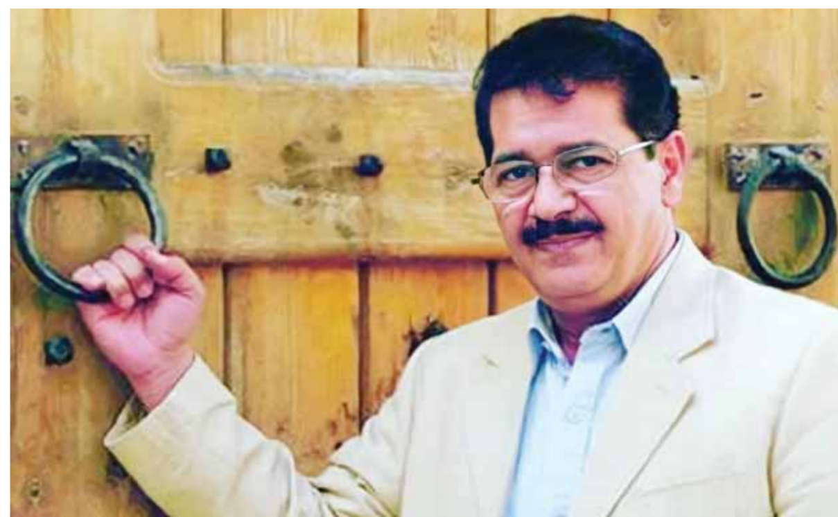
وائل العدس |

مخرج نكي وبرع، يحده كثيرون واحداً من أهم المخرجين السوريين والعرب عبر كل الأزمان، وخصوصاً أن معظم الأعمال التي أخرجها أخذت شهرة واسعة، بل إن عمله الأخير «باب الحارة» تخطى الحدود العالمية. إنه أستاذ دراما البيئة الشامية وعربها ومنشئها، وقد برع فيها كونه ابن حرات الشام، إنه المخرج الكبير بسام الملا الذي فارق الحياة صباح أمس في مدينة زحلة اللبنانية، عن عمر ٦٦ عاماً بسبب معاناته مع ولد المخرج الراحل الذي يعد من أبرز صنّاع الدراما السورية في عصرها الذهبي في دمشق في ١٣ شباط عام ١٩٥٦. وعرفت أعماله وخصوصاً تلك التي تناولت البيئة الدمشقية، بجماهيريتها الشديدة، فقد أعيد عرضها على شاشات القنوات الفضائية العربية عشرات المرات، وحقت ولا تزال تحقق نسب مشاهدة مرتفعة. وقد تحولت أعماله المستلهمة من البيئة الشامية إلى كلاسيكيات تتبارى المحطات الفضائية على عرضها، وقد تحول «باب الحارة» الذي عرض جزؤه الأول عام ٢٠٠٦ في ظاهرة اجتماعية اجتاحت العالم العربي والمهجر، وحقت أعلى نسبة مشاهدة عربية على الإطلاق.