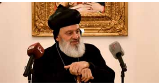
البطريك مار اغناطيوس أفرام الثاني

الإرهاب وذلك لدفعهم للنزوح من أماكن سكنهم. وأعرب البطريك أفرام الثاني عن أمله في أن يقوم الدبلوماسيون بنقل حقيقة الوضع المعيشي للشعب السوري، جراء هذه الإجراءات ومعاناته لدولهم وشعبهم للمساهمة في هذه الإجراءات القسرية عن سورية في أسرع وقت. وشكر قداسة البطريك أفرام الثاني رؤساء وممثلي البعثات الدبلوماسية على وفوفهم إلى جانب سورية وشعبها ودعم دولهم لصمود السوريين، لافتاً إلى أن الانتصارات تحققت على الإرهاب بفضل وحدة الشعب السوري وبمساعدة جيشه وصموده والتعاون مع الشعوب والدول الصديقة. وختم البطريك أفرام الثاني بالتأكيد على أن الشعب السوري يريد السلام والأمان لكل العالم، ولا يعاني أي إنسان كما يعاني هذا الشعب من الأزمات، رغم أن بعض الحكومات الغربية رعت ودعمت الإرهاب وسامت في إيقاع الأذى والضرب على هذا الشعب ووطنه.