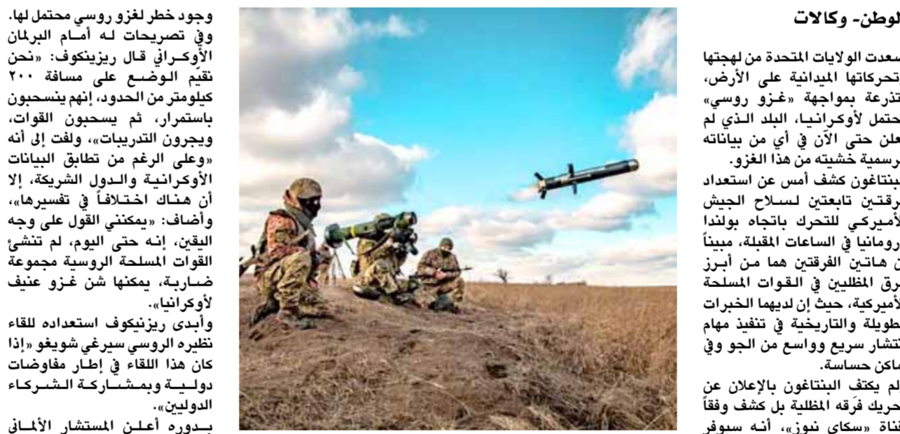
جنود أوكرانيون يستخدمون قاذفة صواريخ أميركية في دونيتسك (عن الانترنت)

وجود خطر لغزو روسي محتمل لها، وفي تصريحات له أمام البرلمان الأوكراني قال ريزنيكوف: «نحن نقيم الوضع على مسافة ٢٠٠ كيلومتر من الحدود، إنهم يسحبون باستمرار، ثم يسحبون القوات، ويجرون التدريبات»، ولفت إلى أنه «وعلى الرغم من تطابق البيانات الأوكرانية والدول الشريكة، إلا أن هناك اختلافاً في تفسيرها». وأضاف: «يمكنني القول على وجه اليقين، إنه حتى اليوم، لم تتشبه القوات المسلحة الروسية بمجموعة ضاربة، يمكنها شن غزو عنيف لأوكرانيا». وأبدى ريزنيكوف استعداده للقاء نظيره الروسي سيرغي شويغو «إذا كان هذا اللقاء في إطار مفاوضات دولية وبمشاركة الشركاء الدوليين». بيدور أعلن المستشار الألماني أولاف شولتز أن ألمانيا تنتظر من روسيا «خطوات لوقف التصعيد» حول أوكرانيا، داعياً لكل لاجئ جهد للخفض التوتر، وقال شولتز خلال مؤتمر صحفي مشترك مع الرئيس الفرنسي إيمانويل ماكرون: «ترحب بالحوار مع روسيا ضمن مختلف الصيغ، وخاصة رباعية نورماندي التي تضم روسيا وأوكرانيا وألمانيا وفرنسا، مشيراً إلى أن ذلك يجب أن يساعد في تسوية الأزمة».