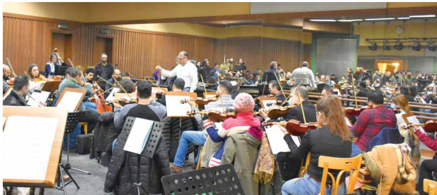
من تحضيرات «الرابسودي السوري»