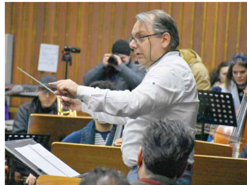
المايسترو ميساك باغبودريان

أن يتم استكمال باقي التحضيرات مع الموسيقيين الآخرين في دبي قبل بدأ الحفل المقرر أقامته في ٧ شباط المقبل».