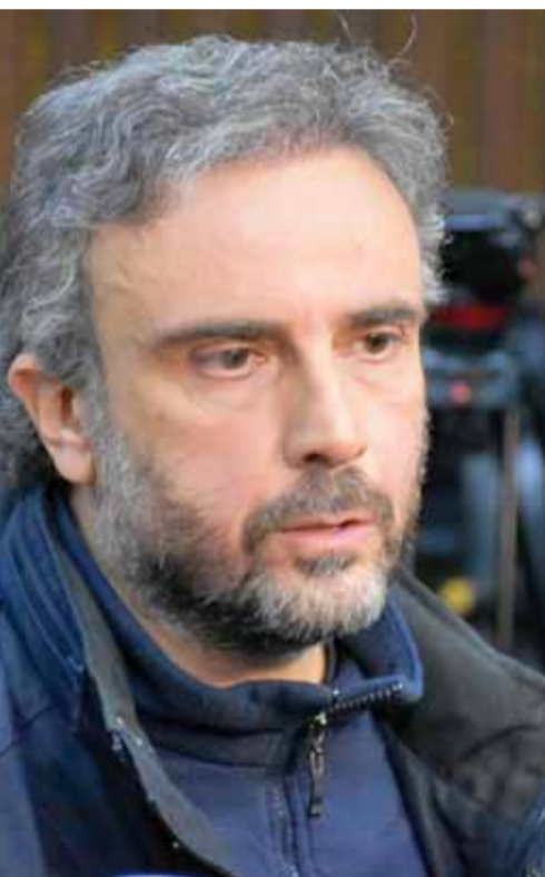
الموسيقار إياد الريماوي

من جانبه بين قائد الحفل المايسترو ميساك باغبودريان: «أن العمل مكتوب بلغة أوركسترا الية تتضمن عدة ألوان من الموسيقى الشرقية وعناصر أوركسترا الية كلاسيكية وألات شرقية منفردتين وكورال»، وأشار باغبودريان: «إلى أن الموسيقيين المختارين للعمل هم من أهم الموسيقيين السوريين،