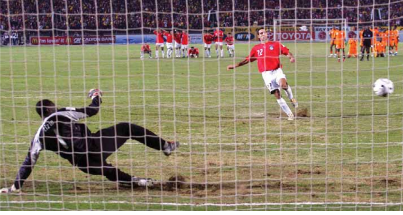
م فوز مصر على ساحل العاج بركلات الترجيح