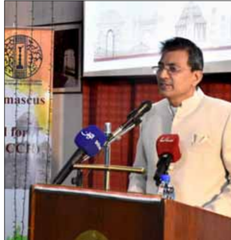
سفير الهند في سورية ماهيندر سينغ كانيال

عبر سفير الهند في سورية ماهيندر سينغ كانيال، عن سعادته بالتطورات الإيجابية في سورية ويدعم من المجتمع الدولي صنعيح مستقرة وتوسع وتوسع إلى وضعها الطبيعي خلال الأشهر القادمة. وفي تصريح لـ«الوطن» على هامش الاحتفالية التي أقامتها السفارة الهندية في دمشق بمناسبة الذكرى الثالثة والسبعين ليوم الجمهورية، أكد كانيال بأن بلاده فخورة بعلاقتها مع سورية وعلاقات الصداقة والتعاون معها، علماً أن الجانبين يتعاونان بشكل فاعل في الأمم المتحدة والمحافل الدولية. وفيما يتعلق بالعلاقات بين الهند وسورية، أكد كانيال أنه يجري العمل حالياً على مشاريع مختلفة وهي قيد الدراسة حالياً، وتشمل هذه المشاريع زيادة عدد المنح الدراسية للطلاب السوريين، معياراً عن أمه في أن تتحسن الأوضاع خلال الأسابيع القادمة عقب استئناف إعطاء المنح الدراسية من جديد، وأضاف: «تأمل أن يحدث ذلك قريباً جداً، علماً أنه تم الإعلان عن منح دراسية مقدمة من الهند في الأسبوع الماضي أيضاً». سفير الهند أشار إلى أن بلاده تعمل أيضاً على كيفية تقديم المزيد من المساعدة الإنسانية، وفقاً لمتطلبات سورية الصديقة، وكذلك تقديم المساعدة التقنية أيضاً. وكشف كانيال أنه من المتوقع أن تكون هناك زيارات رسمية بين البلدين، ومنها زيارة رسمية لمسؤولين من الهند إلى سورية تجري ربما الشهر القادم، كما سيزور سورية في نيسان القادم وفد هندي متخصص في مجال تركيب الأطراف الصناعية، وأضاف: «نتوقع المزيد من الزيارات ليس فقط من الهند إلى سورية ولكن أيضاً من سورية إلى الهند». وبالمناسبة للتعاون الاقتصادي أكد كانيال أن البلدين مستفران بالتعاون، مبيناً بأنه على تواصل مع رجال