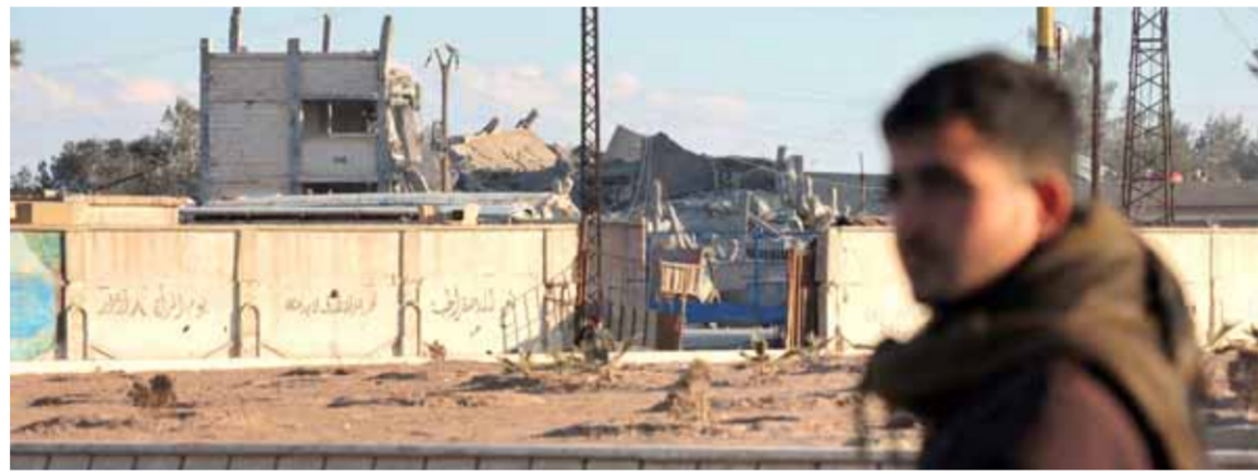
مليشيات «قسد» أعلنت عن انتهاء العمليات العسكرية في «سجن الصناعة»

التغطية على التحديات الأساسية التي تواجهها سورية، وصرف النظر عن الممارسات العدوانية التي تقام الوضع فيها وتلقي بأثارها الكارثية على حياة كل سوري، وشدد صباغ على أنه من غير المقبول الاستمرار في تجاهل الانتهاكات الخطيرة لسيادة سورية واستقلالها ووحدة وسلامة أراضيها، مؤكداً أن على مجلس الأمن أن يتحرك وبشكل عاجل وحازم، لفرض احترام قراراته وقرارات الأمم المتحدة الأخرى المتعلقة بالحوار السوري المحتل، وإنهاء الاحتلال التركي للأراضي السورية، ووقف جرائم النظام التركي وممارساته، ووضع حد للوجود الاشرعي للقوات الأميركية في سورية، وإنهاء رعايتها لمليشيات «قسد» الانفصالية، أو لكيانات الإرهابية مثل تنظيم «معاوية الثورة» في منطقة النفق ومخيم الركبان، ووقف سياسات الإرهاب الاقتصادي والعقاب الجماعي المتمثلة بالتدابير القسرية اللاقانونية واللاإنسانية والأخلاقية التي تفرضها الولايات المتحدة والاتحاد الأوروبي على الشعب السوري، ووضع قراراته ذات الصلة بكفاحه الإرهاب موضع التطبيق، ودعم جهود الدولة السورية وحلفائها للقضاء على بقايا التنظيمات الإرهابية، صباغ لفت إلى إحاطة المبعوث الأممي الخاص غير بيرسون، وشدت على ضرورة التزامه بدوره كمسبر، وأن يعمل على تنفيذ نصوص الورقة المرجعية بين الأطراف من دون التدخل في الحوار الموضوعي الذي يدور بين أعضاء اللجنة، وأن يقلص صورة ما يجري بكل حيادية.