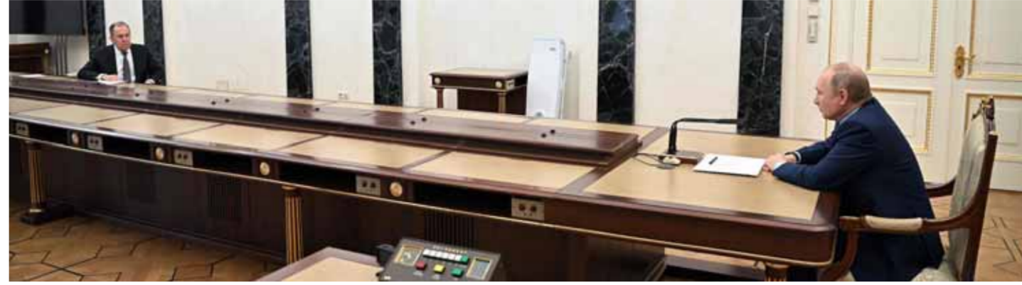
الرئيس الروسي فلاديمير بوتين خلال إجراءه مع وزير الخارجية سيرغي لافروف أمس في الكرملين