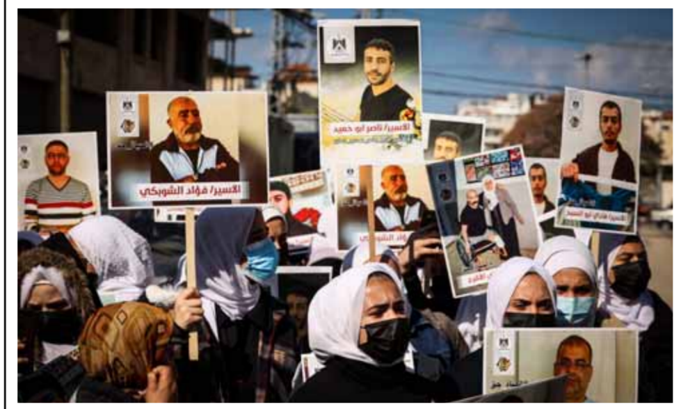
فلسطينيون يحتشدون لدعم الأسرى في سجون الاحتلال الإسرائيلي خارج مبنى اللجنة الدولية للتسليم الأسرى في مدينة غزة (أ.ب.)

تصل إلى إجرائهم حرب وجرائم ضد تصل إلى إجرائهم حرب وجرائم ضد تصل إلى إجرائهم حرب وجرائم ضد