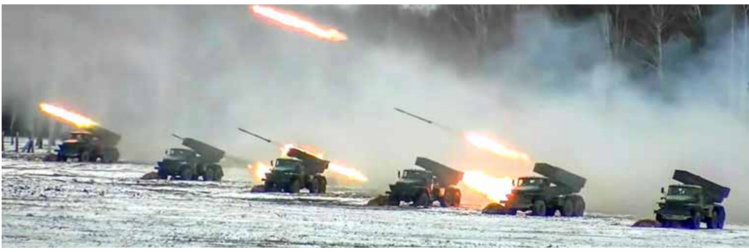
من مناورات القوات الروسية في بيلاروس على الحدود الأوكرانية

وقوات الحوار تبقى مفتوحة». من جانبها نقلت شبكة «سي إن إن» عن مصادر استخباراتية أميركية قولها: إن «القوات الروسية دخلت مرحلة الإعداد النهائي لاستخدام خيار عسكري ضد أوكرانيا». وفي السياق أعلن رئيس مجلس الدوما الروسي فلاديمير فولودين أن المجلس سيبحث اليوم مشروع قرارين بشأن التوجه للرئيس فلاديمير بوتين بطلب الاعتراف باستقلال جمهوريتي دونيتسك ولوغانسك. وأشار فولودين إلى أنه خلال اجتماع هيئة الدوما أمس، تقرر تقديم مشروع القرارين للجلسة العامة المقررها اليوم الثلاثاء.