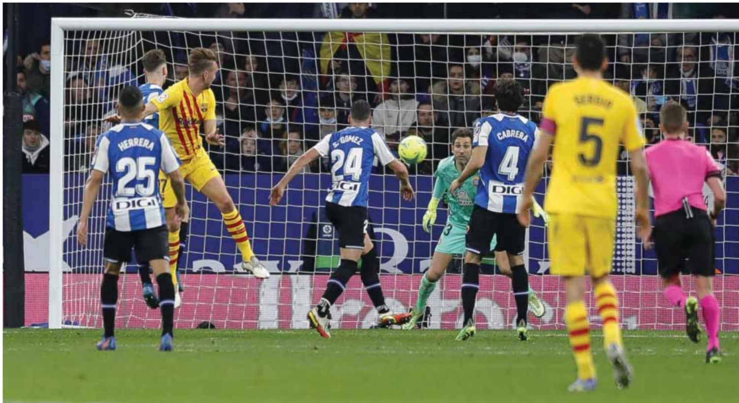
لوك دي بونغ أفض البرشا من الخسارة بهذه الكرة

– بطاقتان بغير هدف في المباريات التسع منها صفراواتان في مباراة نابولي × إنتر مقابل ٦ صفراوات وحمرء في مباراة تورينو × فينسيا وطرد جيان ماركو فيراري (ساسولو) بعد