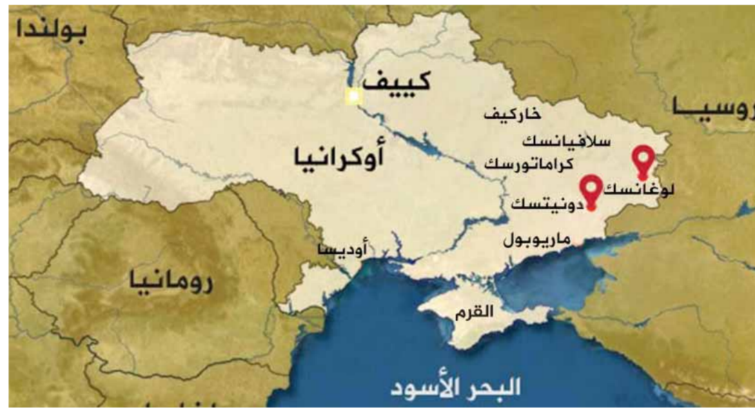
خريطة توضح مناطق قصف القوات الأوكرانية لأراضي جمهورية دونيتسك ولوغانسك المملكتين ذاتياً بأسلحة محظورة في خرق لاتفاقية «مينسك» التي تبناها مجلس الأمن الدولي عام ٢٠١٥ والتي رسمت حدود وقف إطلاق النار.

من جهته أعلن وزير الخارجية الأميركي، أن بلاده على استعداد للرد على أي «اعتداء من روسيا» في حال دعت الضرورة لذلك، مشيراً إلى أن الوضع في أوكرانيا يتطور وفقاً للسبب الذي توقعته واشنطن. وأشار بليتنك إلى أن الرئيس الأميركي، مستعد دائماً لمقابلة الرئيس الروسي، إذا كانت هذه الاتصالات تساعد في تعزيز السلام. من جهته وقع الرئيس الروسي فلاديمير بوتين مرسوماً يقضي باستدعاء الاحتياط من مواطني بلاده للتدريب العسكري، وأعلن المتحدث باسم الكرملين ديميتري بيسكوف أن بوتين أعطى أمراً ببدء مناورات «الردع الإستراتيجي» للصواريخ الباليستية وأشرف عليها شخصياً من مركز العمليات الرئاسية في الكرملين بحضور الرئيس البيلاروسي ألكسندر لوكاشينكو. بدوره قال رئيس مجلس الدوما الروسي فياتشيسلاف فولودين: إن موسكو لا تريد الحرب، لكنها مستعدة للدفاع عن مواطنيها في دونيتسك ولوغانسك. من جهتها أعلنت المتحدة باسم وزارة الخارجية الروسية ماريا زاخاروفا، أن الممثلين الغربيين سيصبحون مشاركين في الجرائم ضد الإنسانية من قبل سلطات كييف إذا وصلوا تجاهل الوضع المأساوي لسكان منطقة دونباس شرق أوكرانيا. وحول سحب الولايات المتحدة ممثلها من