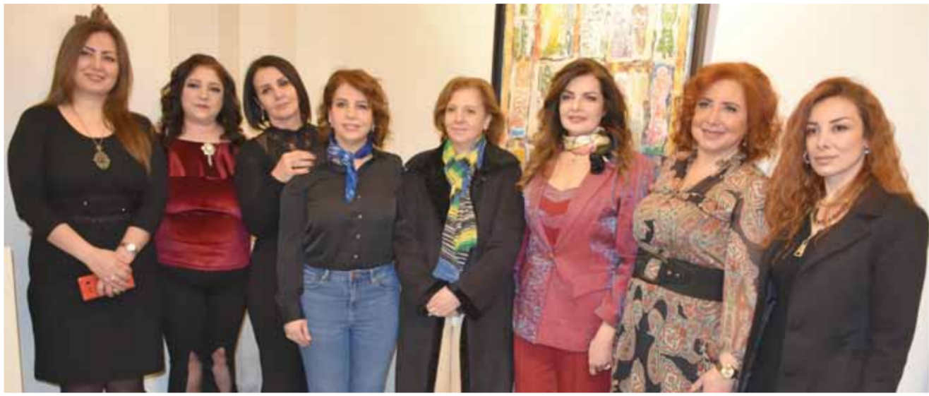
وزيرة الثقافة د. لباتة مشوح مع فنانات مشتل

التاريخ والعاطفة والأسرة والمشكلات التربوية التي واجهت نساء أوغاريت في التربية، وتعكس الفرح والحزن والأمل أيضاً، إضافة للانطلاقة نحو مستقبل أفضل.