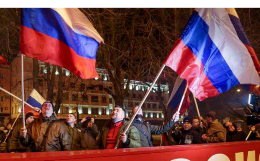
احتفالات في دونيتسك بالاعتراف الروسي بالجمهورية الشعبية المستقلة (عن الانترنت)

الواحد على الكرة الأرضية أم لا والأمر مرتبط بالجغرافيا السياسية وسورية بالمعنى الجيوبوليتيكي جزء من هذا المشهد». ورأى الجعفري أن بوتين هو زعيم كبير مدرك لما يجري داخل سورية وشارك بمحاربة الإرهاب، وتم إنشاء قاعدة حميميم في سورية لمحاربة الإرهاب واليوم تم توسيع