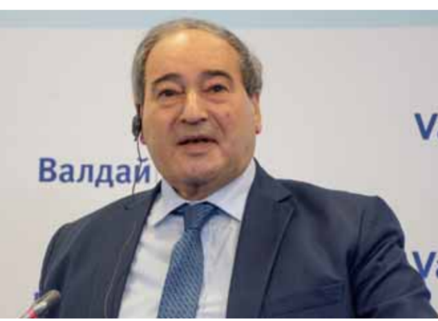
وزير الخارجية والمغتربين فيصل المقداد خلال «منتدى فالداي» في موسكو

الشأن الإنمائي مهتمة بدراسة وتمويل مشاريع الاحتياجات الرئيسة للمواطنين السوريين. وكنتها أبلغتنا أنها تلقت رسالة تحذير شديدة من وزارة الخزانة الأميركية ومن مسؤولين في الإدارة الأميركية مضمونها أن الاستثمار في الطاقة الكهربائية المتجددة في سورية هو خط أخطر. وشهد المقداد على أن مسؤولي وموظفي الحكومة الأميركية يكذبون عندما يقولون إن العقوبات الأميركية لا تؤثر على دخول المواد الغذائية والمساعات الإنسانية والأدوية والإمدادات الطبية إلى سورية، فهذا الادعاء هو محض افتراء وما تسمى «استثناءات تمنحها وزارة الخزانة الأميركية» لا تزال تخضع لاعتبارات مسبقة تناقض مصالح السوريين وتطعناتهم لحياة أفضل.