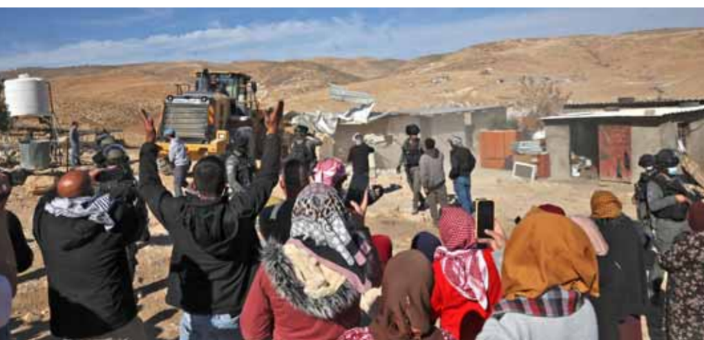
جرافات إسرائيلية تهدم منازل فلسطينية موقفة في قرية الفتح جنوب يطا في الضفة الغربية المحتلة

كثيرة، يتراجع ويبنى الجدر لحماية نفسه، منها بان الذين يتفنون أن قدر الشعب الفلسطيني أن يلثيم وراء الكيان الإسرائيلي، ليهبه بعضاً من حقوقه، واهمون، قائلاً: ما كان من اتفاقيات مع العدو ليس سوى خدعة كبرى، وعملية تويه خطيرة ومدمرة، لتمر بنو إسرائيل إلى كل العواصم، محققين هيمنتهم على المنطقة. وشدد على أن القدس تحت سيطرة العدو الصهيوني المباشرة منذ خسين عاماً، وأن العدو يقدم على تدنس القدس والمسجد الأقصى يومياً وبلا كل الوتق، مضيفاً: علينا أن نعمل بلا كل أو ملل، ويكل الوسائل، من أجل تحرير القدس.