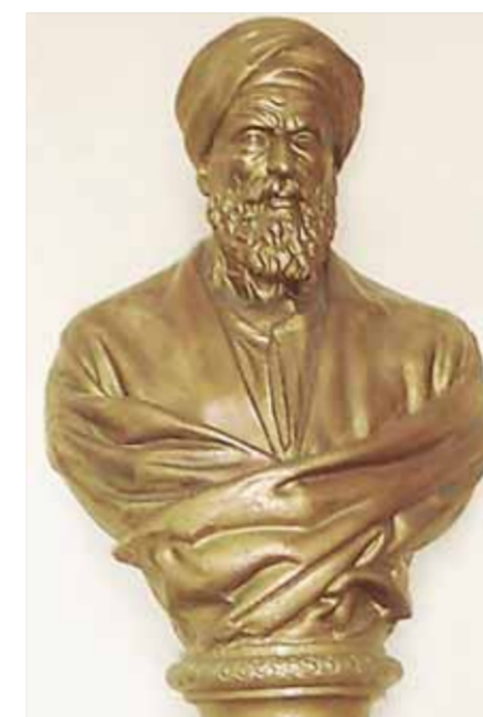
تمثال أبو العلاء المعري