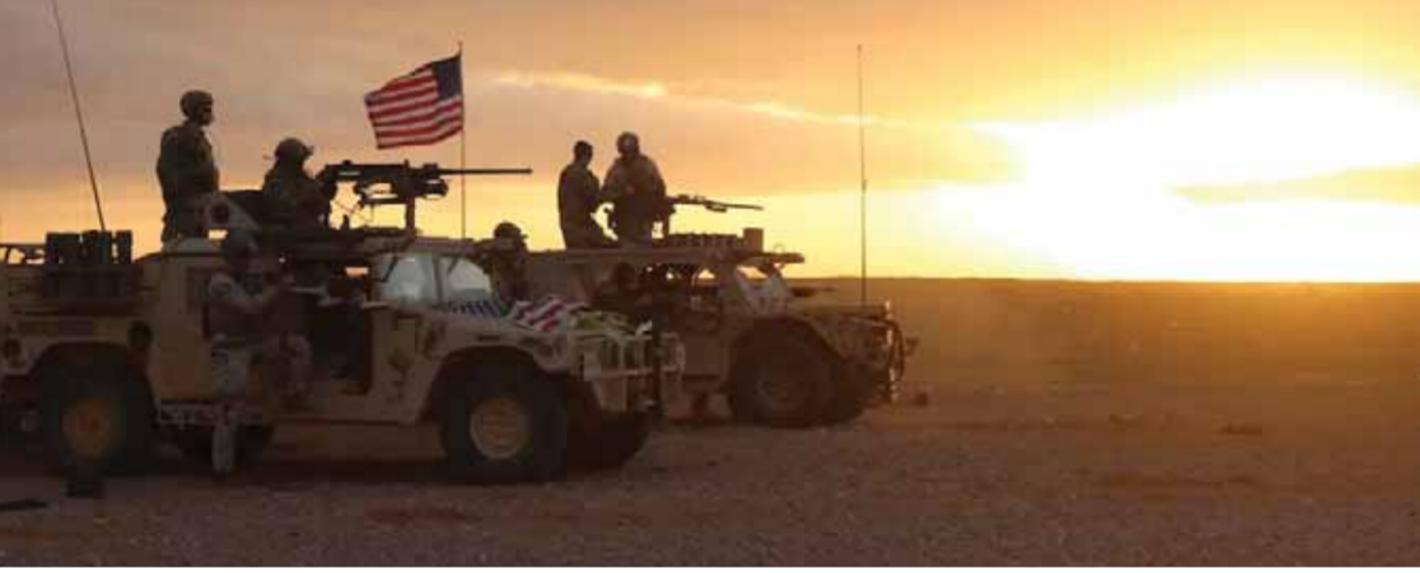
الاستخبارات الأميركية جهزت قبيل بدء العملية العسكرية الروسية في أوكرانيا أكثر من ٢٠٠ إرهابي من «داعش» في قاعدة التنف السورية الخاضعة لسيطرة الاحتلال الأميركي