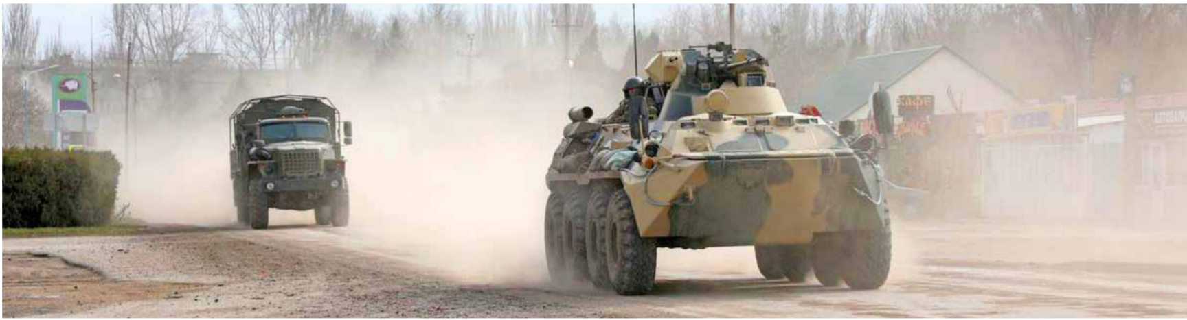
تقدم القوات الروسية في المدن الأوكرانية مستمر (عن الانترنت)

لشؤون الأمن القومي جيك ساليغان الصين، من أي محاولات لدعم الاقتصاد الروسي والتقليل من تداعيات العقوبات الغربية ضد روسيا. وقال ساليغان لقناة CNN: «نتابع عن كثب الحجم الحقيقي للدعم المادي والاقتصادي الذي تقدمه الصين لروسيا، ولقد أبلغنا بكن باننا لن نسجم ولن نقبل بأن تحاول أي دولة كانت تعويض خسائر روسيا الاقتصادية»، معتبراً أن مثل هذه المحاولات ستكون لها «عواقب» بالنسبة للصين، من دون أن يكشف عما إذا كانت الولايات المتحدة مستعدة لغرض عقوبات على بكن. بالتوازي، قال البيت الأبيض: إن وفداً أميركياً عالي المستوى سيلتقي اليوم مسؤولاً صينياً رفيعاً في العاصمة الإيطالية روما. ويناقش مستشار الأمن القومي الأميركي جاك سوليغان مع كبير الدبلوماسيين في الحزب الشيوعي الصيني يانغ جي شي «الجهود الجارية للتعامل مع المناقشة بين البلدين، وتداعيات الحرب الروسية ضد أوكرانيا على الأمن الإقليمي والدولي»، وذلك وفق ما جاء في بيان صدر عن الناطقة باسم مجلس الأمن القومي الأميركي إميلي هورن. يأتي ذلك في وقت أشاد فيه رئيس قوات الحرس الوطني الروسي فيكتور زولوتوف بأداء مقاتلي قواته والتقدم الكبير الذي يحرزونه في العملية العسكرية الروسية في أوكرانيا، وأكد أنهم يحققون أهدافهم خطوة خطوة، وقال: «أريد أن أنقل إليكم وإلى جميع المواطنين، أن قوات الحرس الوطني جنباً إلى جنب مع القوات المسلحة الروسية، تنجز جميع المهام الموكلة إليها في هذه العملية العسكرية الخاصة». وأضاف: «ليس كل شيء يسير بالسرعة التي نريدها، ولكن هذا فقط لأننا نأخذ الترتيبات الجدية بحسبنا ونرى ظهور الدمين». مقاتلون يتقدمون نحو أهدافهم خطوة خطوة..