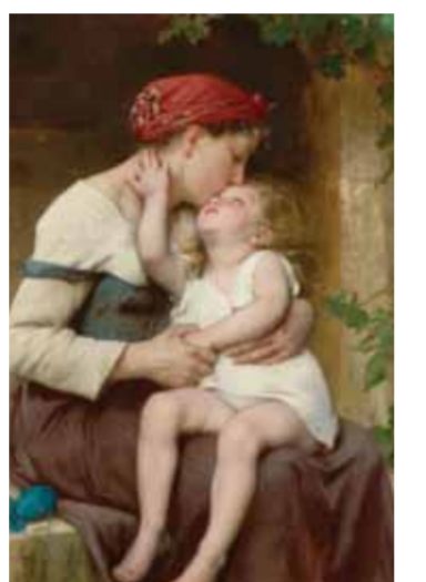
.. ولجان بازيل