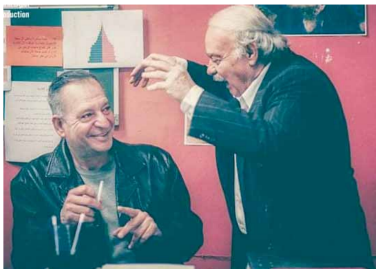
من مسلسل «الفرسان الثلاثة»

هذا العام ستقدم هذه الدراما من خلال ثلاثة مسلسلات لعلها تلقى الترحيب وتعود إلى مجدها فكلنا بالانتظار.