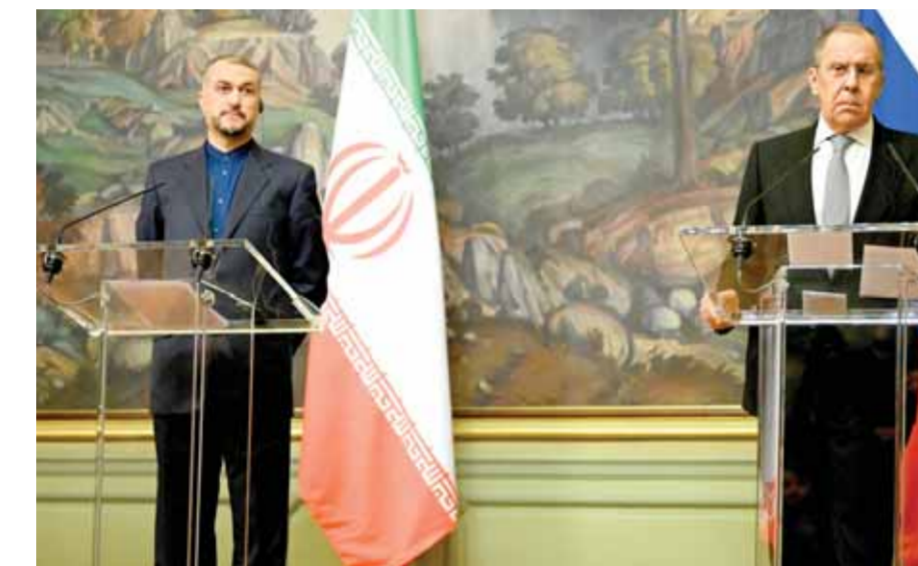
وزير الخارجية الروسي في مؤتمر صحفي مع نظيره الإيراني أمس الثلاثاء في موسكو

على الهيمنة الأميركية وراهنه على احتواء روسيا عن طريق المواجهة. وتتضمن العقوبات التي فرضتها روسيا على الولايات المتحدة المنع من دخول روسيا، وضمت القاضية أيضاً رئيس هيئة الأركان المشتركة مارك ميلي بالإضافة إلى عدد من رؤساء الإدارات والمسؤولين الأميركيين. وفي وقت لاحق أمس أعلنت الخارجية الروسية، فرض عقوبات شخصية على رئيس الوزراء الكندي جاستين ترودو، ووزيري الدفاع والخارجية الكنديين، وأغلبية نواب مجلس العموم في البرلمان الكندي. الرئيس الأوكراني فولوديمير زيلينسكي، اعتبر في تصريحات له أمس، أن على أوكرانيا التصالح مع فكرة أنها لن تكون جزءاً من حلف شمال الأطلسي، وقال: «لقد سمعنا لسنوات عن الأبواب المفتوحة المقترضة، لكننا سمعنا أيضاً أنه لا يمكننا الدخول إلى هناك، هذا صحيح، ونحن بحاجة إلى الاعتراف بذلك». تصريحات زيلينسكي جاءت بالتزامن مع إعلان مستشار الرئاسة الأوكرانية بأن المفاوضات مع روسيا ستتألف اليوم، واصفاً المفاوضات بالصعبة للغاية وهناك تناقضات جوهريه لكن هناك مجال لحل وسط. وعلى حين لفت الأمين العام لحلف «الناتو» ينس ستولتنبرغ، إلى أن التحالف بصدد تغيير وضعه الأمني في أوروبا بشكل جذري، حذر صندوق النقد الدولي الاتحاد الأوروبي من التعرض لركود اقتصادي عميق نتيجة التوتر حول أوكرانيا والعقوبات ضد روسيا.