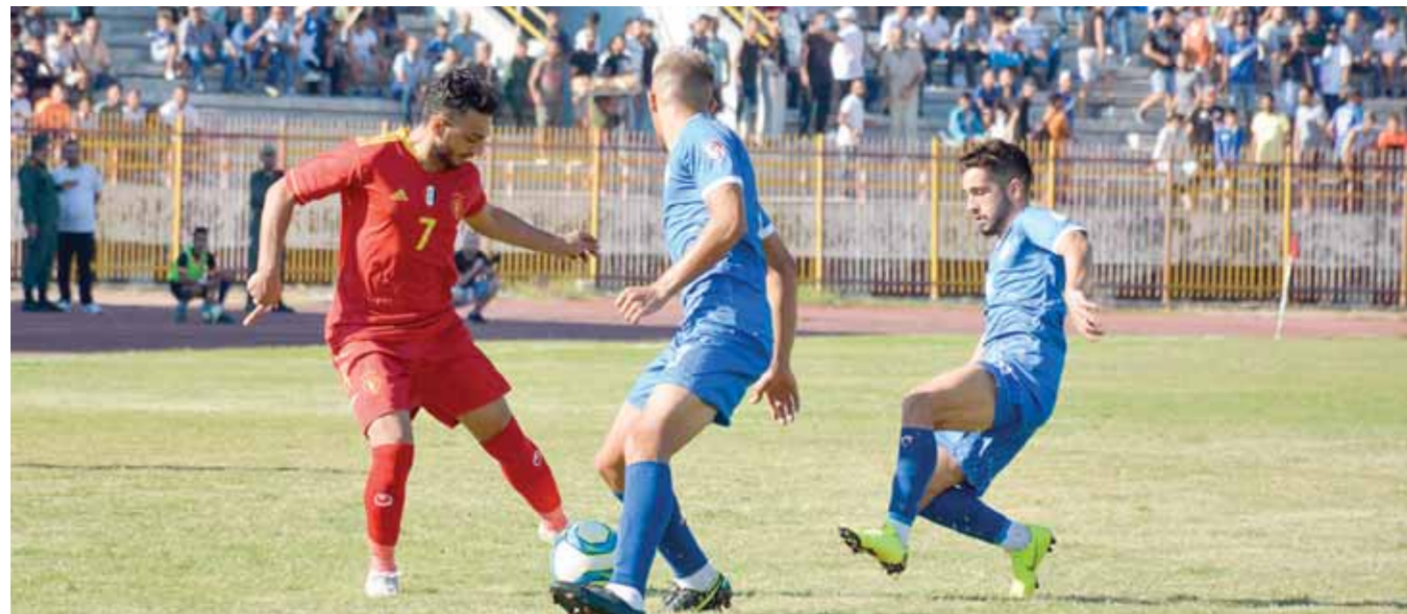
من أرشيف ديربي تشرين وحطين

بها اللاعبون وتوجيههم لتجنبها وعدم تكرارها. وأضاف: نذكر أهمية وصعوبة وحساسية المباراة ذلك عمدنا إلى إبعاد اللاعبين عن الشد والشحن العصبي والنظر إليها على أنها مثل أي مباراة في الدوري الفائز ينال فيها النقاط الثلاث ولا مجال للتفریط بأي نقطة حتى لا يتسع فارق النقاط مع المتصدر الوثبة مدركين في الوقت ذاته أن فريق حطين ورغم موقعه على سلم الترتيب بأنه فريق قوي وموقعه على سلم الترتيب لا يناسبه وهو سيعمل جامداً للفوز أيضاً لتحصين وضعه ومن هنا نذكر أيضاً صعوبة المباراة ونعلم أيضاً أن حطين يحافظ الحظ والتوفيق في الدقائق الأخيرة وقد وضعنا في الحسبان كل شيء.