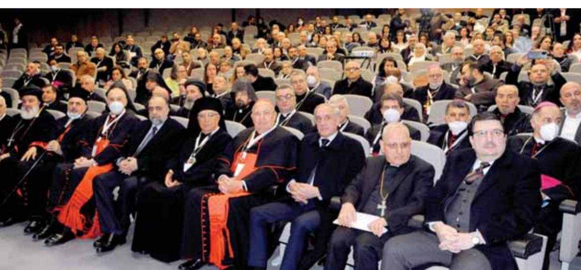
جانب من الحضور في مؤتمر «الكنيسة بيت للمحبة.. مسيرة مشتركة» في قصر المؤتمرات بدمشق

السورية عانت على مدى سنوات من الحرب العدوانية الإرهابية التي دعمتها العديد من الدول التي تدعي الديمقراطية وحماية حقوق الإنسان، في حين هي في الحقيقة تدعم الإرهاب والفكر المتطرف الذي يستهتر بالأديان وتعاليمها الداعية إلى المحبة والسلام وكرامة الإنسان. وبين السيد، أن أدوات وعملاء هذه الحرب الإرهابية هموا المساجد والكنائس والمدارس والخطفوا وقتلوا علماء ورجال دين مسلمين ومسيحيين، مؤكداً أن سورية وشعبها وجيشها وقائدها كانوا دائماً المدافعين عن المحبة والسلام في وجه الإرهاب وداعيمه. وفي تصريح ل«الوطن»، أكد بطريرك الكنيسة السريانية الأرثوذكسية في سورية أغناطيوس