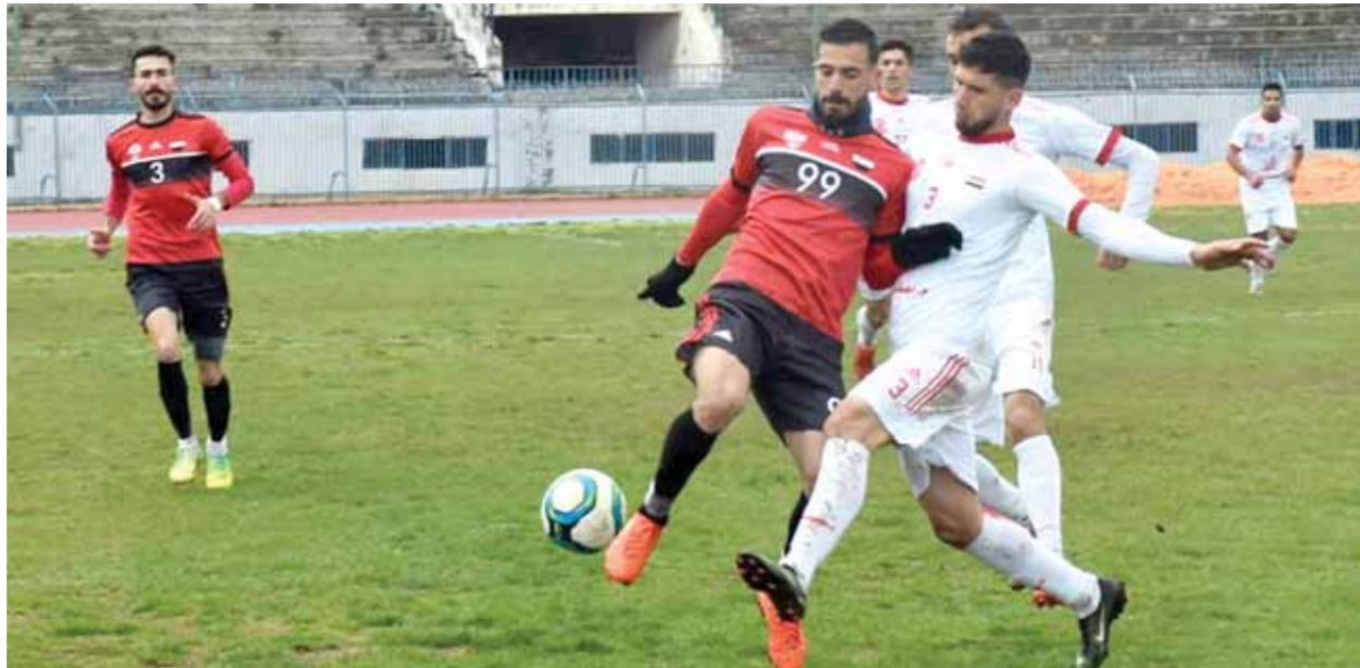
من خسارة الطليعة أمام الوثبة