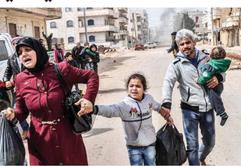
أهالي «عفرين» ينددون بأعمال النهب التي تقوم بها ميليشيات موالية للنظام التركي

مجموعات من أهالي المناطق التي يحتلها شمال شرق البلاد، وهو بنى تجمعات عديدة في محيط المدينة لإيواء نازحين من مناطق مختلفة وكشفت المصادر عن تجنيد أكثر من 10 آلاف مرتزق من «الجيش الوطني» المنتشر في عفرين، معظمهم من ميليشيات «فرقة السلطان سليمان شاه»، بالإضافة إلى ميليشيات «السلطان محمد الفاتح» و«السلطان مراد»، و«فرقة الحزمة»، ممن زجهم بنظام أردوغان للقتال في ليبيا وإقليم ناغورني كاراباخ، وأخيراً في أوكرانيا ضد الجيش الروسي. بين مصدر ميداني لـ«الوطن»، أن وحدات الجيش العاملة بريف حماة الشمالي الغربي، استهدفت برمايات من مدفعيتها الثقيلة، مواقع لتتظيم «النصرة» وحلفائه، في العنكاوي، وعدة محاور بسهل الغاب الشمالي الغربي، موضحاً أن الوحدات العسكرية العاملة بريف إدلب استهدفت أيضاً، نقاط تركز التنظيمات الإرهابية في لفيقل وبينين بريف إدلب الجنوبي. وأوضح المصدر، أن استهدافات الجيش للإرهابيين تمت ترداً على حرق مجموعات إرهابية تمت تسمية فرقة عمليات «المين» مجدداً اتفاق وقف إطلاق النار بمنطقة «فخض الصعدي»، باعتدائها بجرم أسس بقذائف صاروخية على نقاط للجيش في محاور بريف إدلب الجنوبي.