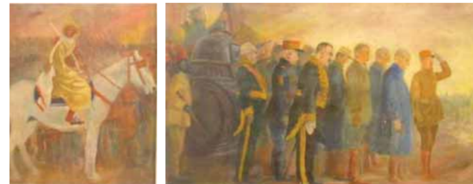
يوم لم يكن لدينا حبش

أما اللوحة الثانية التي أثار تثيراً كثيراً من التساؤلات فتحمل تاريخ ١٩٥٦ سنة العدوان الثلاثي على مصر. وقد حملت تويلاوات كثيرة قبل أن يلحظ الحضور اسم (بور سعيد) المدون عليها. فقد أخذ العلم الأحمر الذي يشغل مساحة واسعة فيها والزعم الذي يقف قبائنه تفكيرهم بعيداً عن مكان وزمان الحدث. وكان لا بد من الانتباه إلى الشعر البريطاني على طائرات تنتمي إلى زمن غير زمن الثورة الروسية أو الحرب العالمية الثانية. في لوحة (بور سعيد)، عبر ميشيل كرشه عن مشاعر اجتاحت الوطن العربي من أقصاه إلى أقصاه سخطاً على العدوان وتقديساً للمقاومة الباسلة التي أبداهم الشعب المصري وابتهاجاً بالوقوف السوفيتي المناصر للشعب المصري. وقد استعزج في جزء أساسي من اللوحة أسلوب الفن السوفيتي في تلك المرحلة وخاصة فن المصفاة، وفن النصب التذكارية إضافة إلى تصوير (المارشال بولجانين) رئيس الوزراء السوفيتي