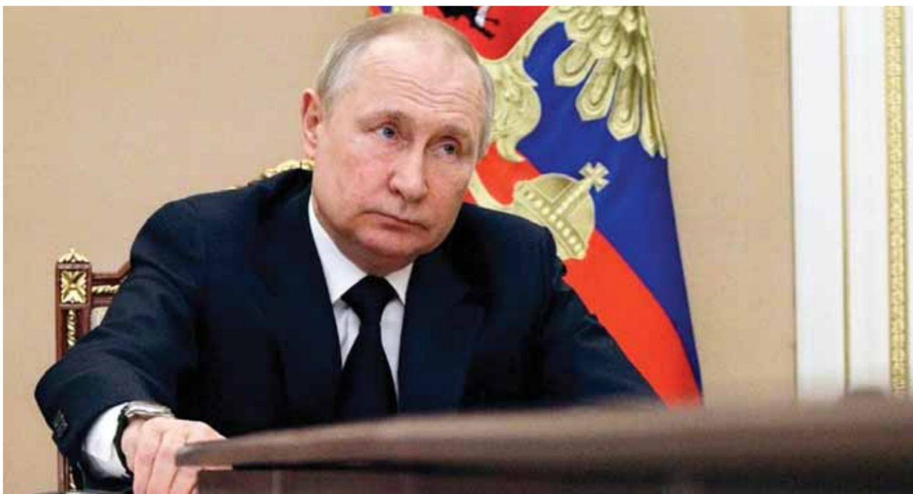
الرئيس الروسي فلاديمير بوتين خلال جلسة لدعم الأقاليم الروسية (عن الانترنت)

«الغارديان» البريطانية عن جوسون، لدى وصوله إلى الإمارات أمس: «القرار بشأن مستقبل أوكرانيا يجب أن يكون للشعب الأوكراني ولزبيلينسكي كريس منتخب، والشئ الأكثر أهمية هو أن هجمات بوتين على أوكرانيا يجب أن تتوقف، ولا ينبغي أن ينظر إليها على أنها نجحت» من جانبها أكدت الصين أن استخدام عصا العقوبات خلال السعي للحصول على دعم الصين وتعاونها لن ينجح ببساطة، مطالبة الولايات المتحدة بعدم تفويض الحقوق والمصالح المشروعة للصين بأي شكل من الأشكال.